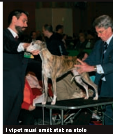
I vipet musí umět stát na stole

ny, která je blíže rozhodčímu. Učí a praktikuje se u psů, kde je třeba opticky mírně schovat strmější úhlení.