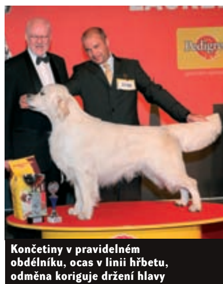
Končetiny v pravidelném obdélníku, ocas v linii hřbetu, odměna koriguje držení hlavy

b) u některých plemen může být držen ladně stranou dolů přes stehno končetiny