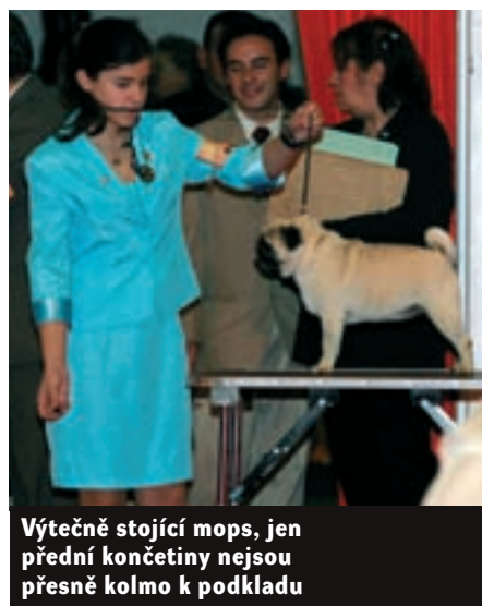
Výtečně stojící mops, jen přední končetiny nejsou přesně kolmo k podkladu

Chcete-li, aby váš pes dobře vypadal, měli byste znát základní pravidla výstavního postoje. Při pohledu zepředu i zezadu by