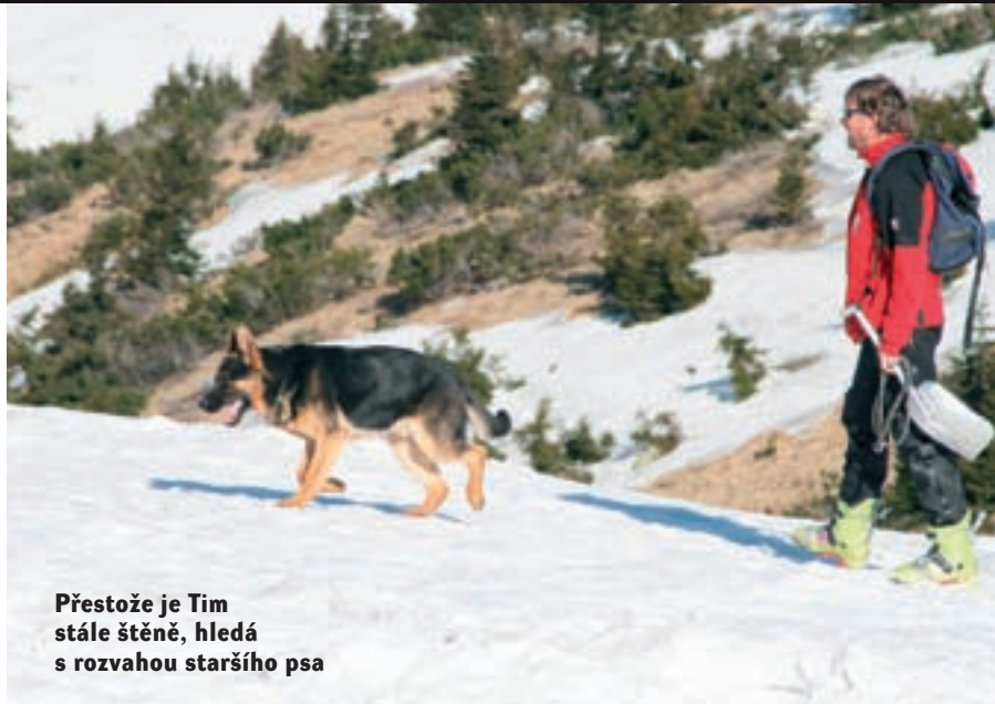
Přestože je Tim stále štěně, hledá s rozvahou staršího psa