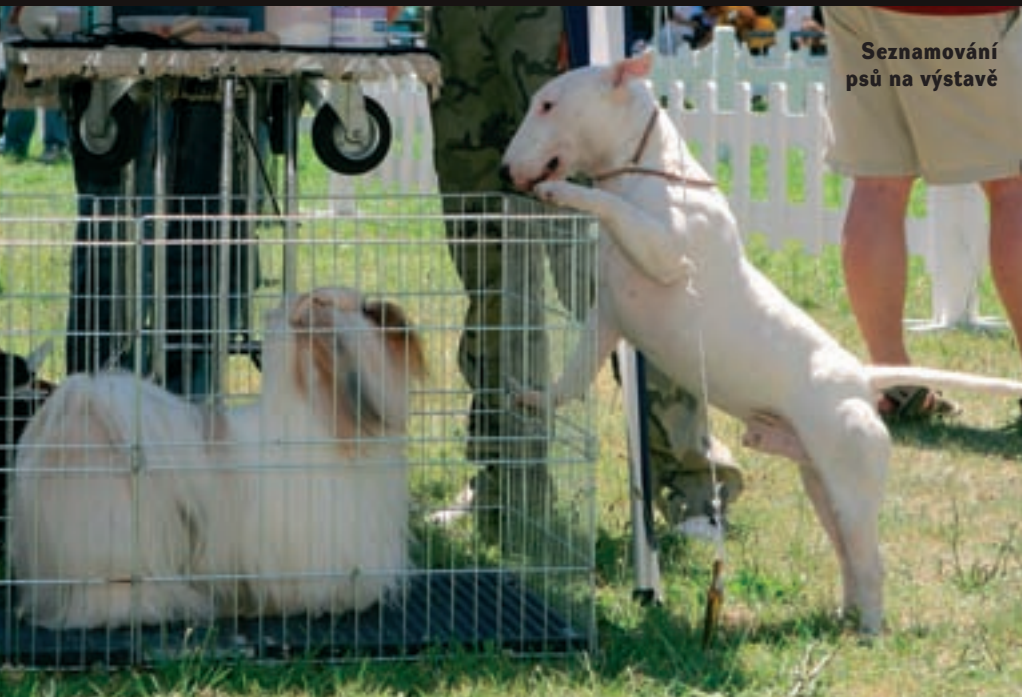
Seznamování psů na výstavě