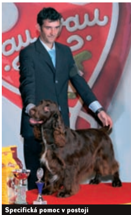
Specifická pomoc v postoji

zentován ve výstavním postoji. Ve většině případů následuje předvedení celé nastoupené třídy psů v pohybu, což znamená pravidelný klus po obvodu kruhu proti směru hodinových ručiček nebo chcete-li na levou ruku. Následuje individuální posouzení jednotlivých psů složené z výstavního postoje v blízkosti posu-