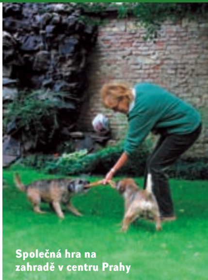
Společná hra na zahradě v centru Prahy

Přitom border není žádné módní plemeno se všemi negativy, která k tomu patří. Ceny štěňat se stále drží na velmi rozumné výši, jistě i proto dosud nejsou v popředí zájmu množitelů a „bezpapírá-