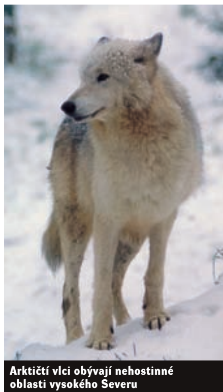
Arktičtí vlci obývají nehostinné oblasti vysokého Severu