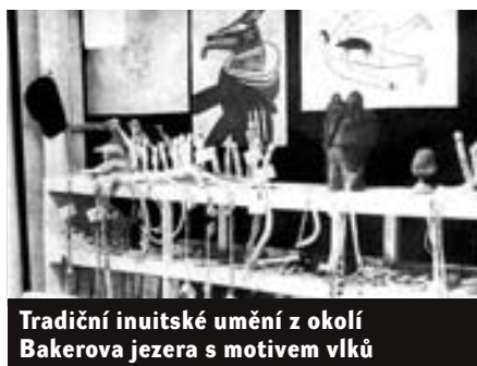
Tradiční inuitské umění z okolí Bakerova jezera s motivem vlků