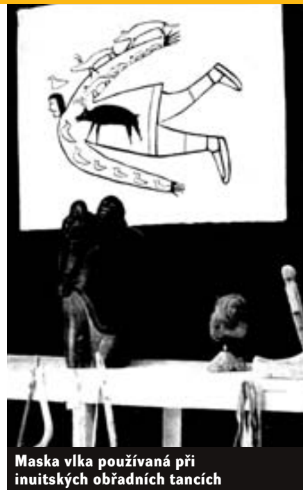
Maska vlka používaná při inuitských obřadních tancích