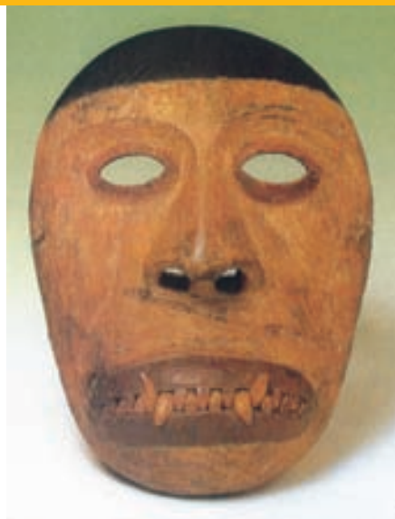
Maska vlka používaná při inuitských obřadních tancích

V jaké podobě - v jaké podobě budu čekat u průduchu - budu čekat u průduchu? V podobě lišky budu čekat u průduchu! V podobě lumíka budu čekat u průduchu! V podobě vlka budu čekat u průduchu! A co budu dělat u průduchu? Lovit tuleně!