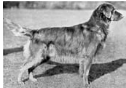
Výstavní postoj a studie hlavy psů z Haulstone, Dan a Simon