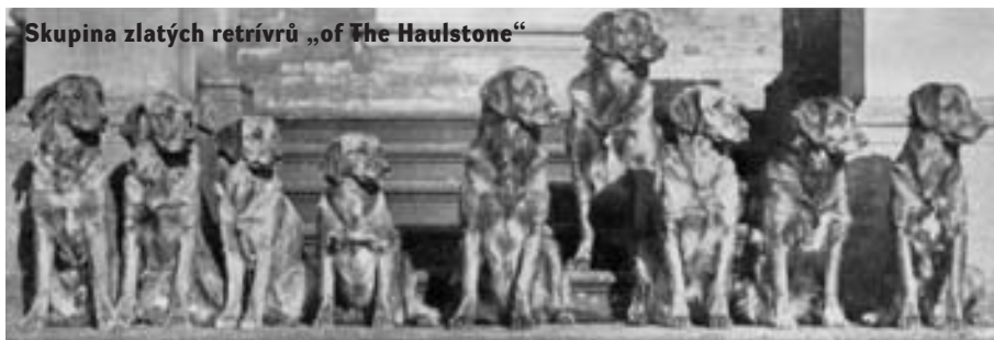
Skupina zlatých retrívrů „of The Haulstone“