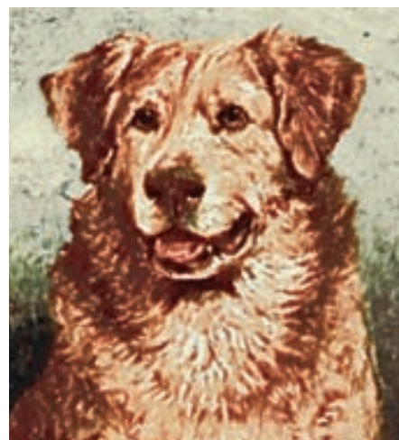
Zlatý retrívř podle portrétu z roku 1898, Anglie

a angličtí retrívři“, očekávající začátek lovu, byli cvičeni na práci pod zbraní. Zlatý retrívř svým vzhledem skutečně více připomíná ostrovní ohaře než pokračovatele linie psů odvozených od novofundlandského psa. Výrazně patrné je to z fotografií „zlatých“ retrívřů