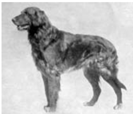
Australský šampion Ottershaw Buzzard chovatele W. Stanleye ze severovýchodního státu Queensland z počátku 20. let minulého století; na černobílé fotografii silně připomíná flat coated (původně wavy) retrívra

v letech 1835 až 1900. Z nich vyplývá, že v roce 1865 koupil v Brightonu žlutého wavy - coated retrívra (flat - coated retrívr) jménem Nous, potomka černě zbarvených rodičů, jehož spojil s fenou