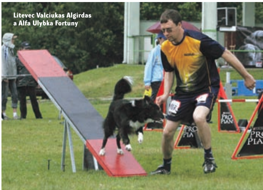
Litevec Valciukas Algirdas a Alfa Ulybka Fortuny