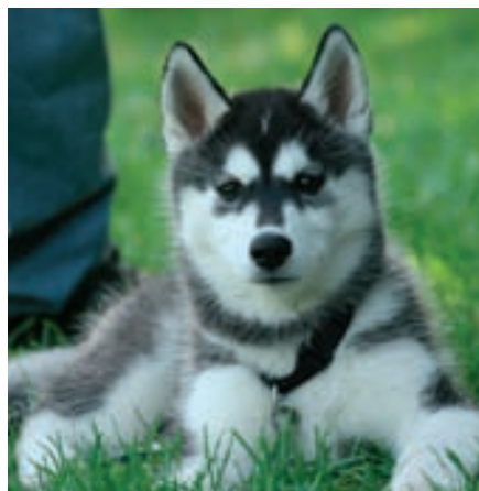
Není pravda, že učení jsou schopna jen štěňata!

Pes chce jít do zahrady, ale zavřené dveře mu to znemožňují. Posadí se tedy před dveře a dá průchod své momentální náladě tím, že trochu zakňučí. V té chvíli přijde člověk a dveře mu otevře. Tak štěně dosáhne prostřednictvím určitého chování, v daném případě kňučení, svého cíle. Když později dojde ke stejné situaci, zachová se stejně. A člověk mu opět otevře dveře. Tím se upevnila zkušenost: „Když zakňučím, ty mi otevřeš.“ Pes zjistí, že svým chováním dokáže vzbudit pozornost, a toho se drží i při jiných příležitostech. Nebude tedy kňučení využívat, jen