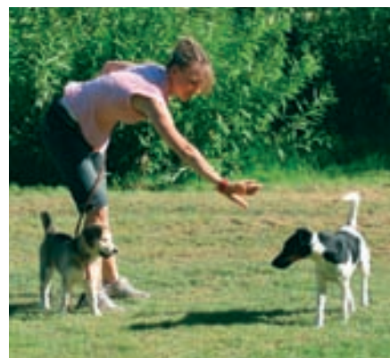
Učí se oba psi: štěně získává jistotu na vodítku, dospělý pes se učí udržovat odstup a nezatlačovat toho druhého

Malý příklad: každý den vyrážíte na procházku stejnou trasou. Všechno je důvěrně známé a vy se můžete v klidu pohroužit do svých myšlenek. Ale najednou je všechno jinak! Přes cestu leží spousta popadaných stromů, důvěrně známé prostředí zmizelo jako mávnutím