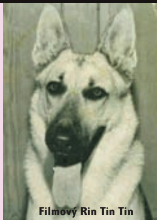
Filmový Rin Tin Tin

1. Jedním z nejslavnějších psů světa je kolie Lassie. Lidé ji dodnes znají z knihy i z několikerého filmového a později i televizního zpracování. Věděli byste, ve kterém roce proslulá knížka Erika Knighta vyšla poprvé?