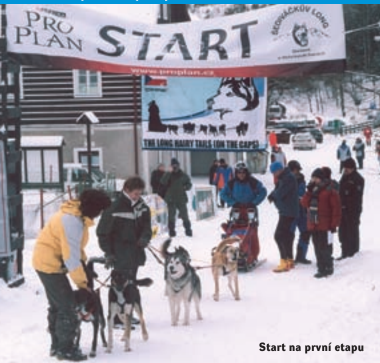
Start na první etapu