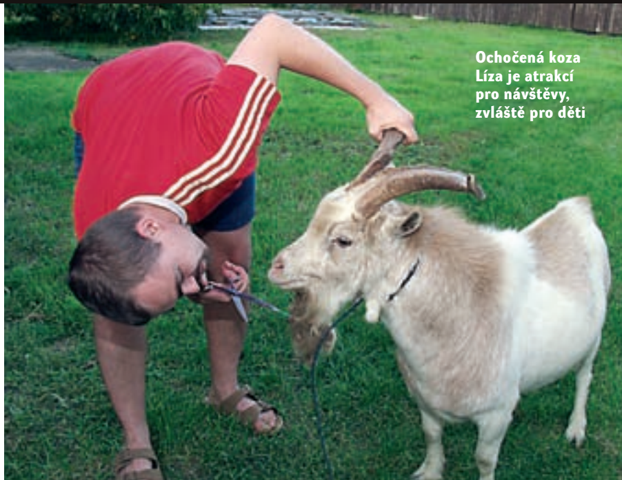
Ochočená koza Líza je atrakcí pro návštěvy, zvláště pro děti

Tonk. Patrik procestoval se psy velkou část zemí Evropy, cesta za výstavními tituly ho zavedla až na Kypr. Za největší úspěch považuje vystoupení na World Dog Show v Amsterdamu. Tam předváděl tři psy různých plemen (peruánský naháč, brabantík, český teriér). Všichni tři byli oceněni titulem Světový vítěz 2002 a dva z nich se stali i vítězi svého plemene (BOB). Pochopitelnou radost měl i z prvního titulu vůbec nejkrásnějšího psa celé výstavy Best in Show (BIS), který získal na MVP Mladá Boleslav v roce 2003 černý střední pudl Chrys Charmant. Tento úspěch zopakovala i fena lhasa apso Ch. Aféra Pibaro v roce 2005 a pes Jch. Big Boss Pibaro v roce 2006. Tak bychom mohli pokračovat dále, ale většinu jeho úspěchů již zdokumentovaly kynologické časopisy.