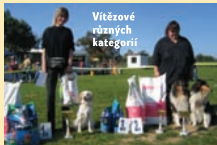
Vítězové různých kategorií

sluze odměnění pytlím krmení Fitmin a Bono a jejich páníčci velikými poháry, které jim ještě dlouho budou doma připomínat krásné výsledky jejich pejsků. Na shledanou v příštím roce!