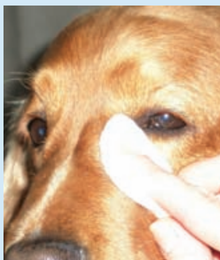
K otření ospalků...