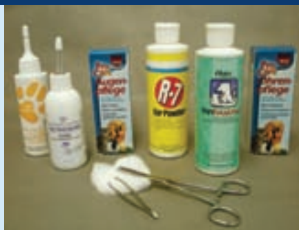
Pomůcky k péči o oči a uši

Trhat srst z uší vašeho psa byste měli pouze, pokud je to nutné k udržení jeho zdravého stavu.