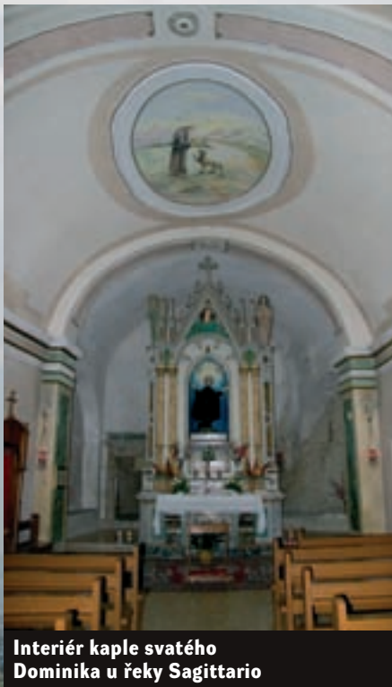
Interiér kaple svatého Dominika u řeky Sagittario

František se se svým (notně vyděšeným) druhem vydal k lesu, kde bylo podle vyprávění místních lidí vlčí doupě. Náhle se ozvalo zavytí. František zamířil k místu, odkud vytí přicházelo, zatímco jeho ustrašený druh prchl do úkrytu za skálu. Vlk stál uprostřed cesty s vyceněnými zuby a chystal se skočit na svou kořist. Františkovo chování ho však mátl: malý neozbrojený vousatý mužík stál před ním klidně a naopak - stále se k němu blížil. „Bratře vlku, neposloucháš svého Pána, když bez jeho svolení zabíjíš ty, které on stvořil. Ve jménu Kristově ti prikazuji, abys už nikdy neublížil ani mně, ani nikomu jinému!“ pravil František tichým, ale rozhodným hlasem. Po těch slovech prý vyhasl krvelačný žár ve vlčích očích, vlk pokorně sklonil hlavu, pomalu přišel před Františka, posadil se k jeho