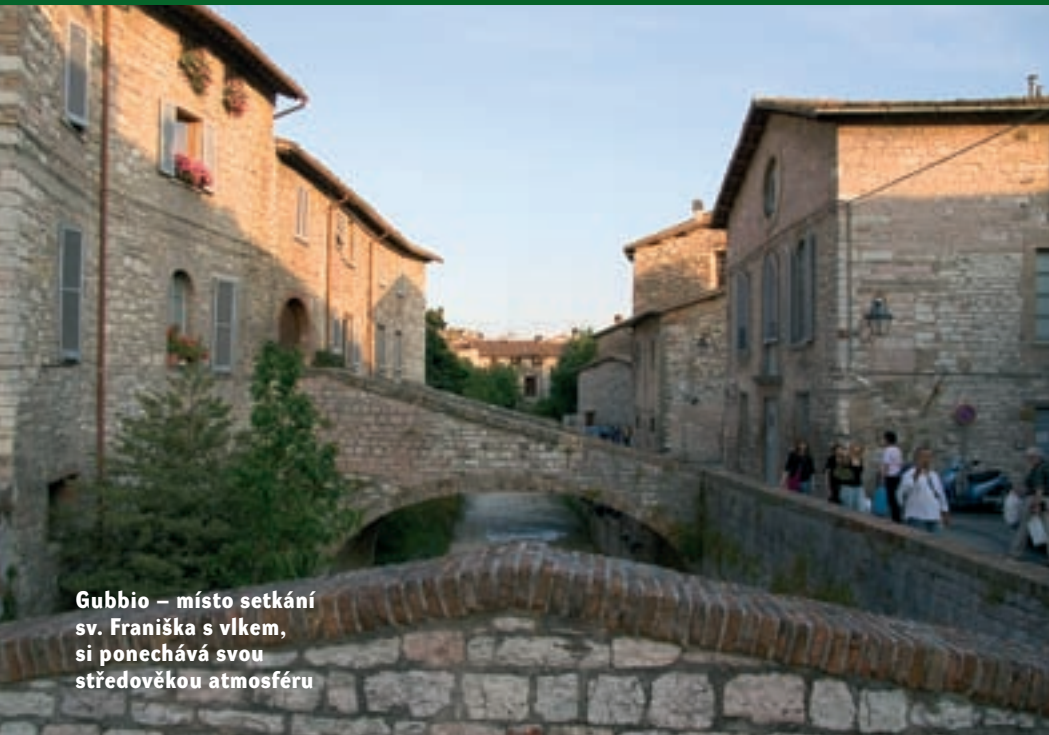
Gubbio – místo setkání sv. Františka s vlkem, si ponechává svou středověkou atmosféru

nohám a na znamení smíru mu podal svou tlapu.