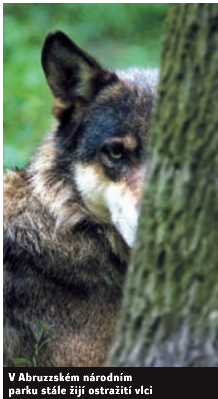
V Abruzzském národním parku stále žijí ostražití vlci

Vlci v Itálii naštěstí stále žijí, i když divočiny v jejich hustě zalidněné zemi na rozdávání určitě není. Apeninští vlci (vědci je označují za Canis lupus italicus ) jsou oproti svým karpatským bratránkům subtilnější. Jejich teritoria najdeme především v divokých a málo zalidněných Abruzzách. Nejvyšší početní stavy vlků