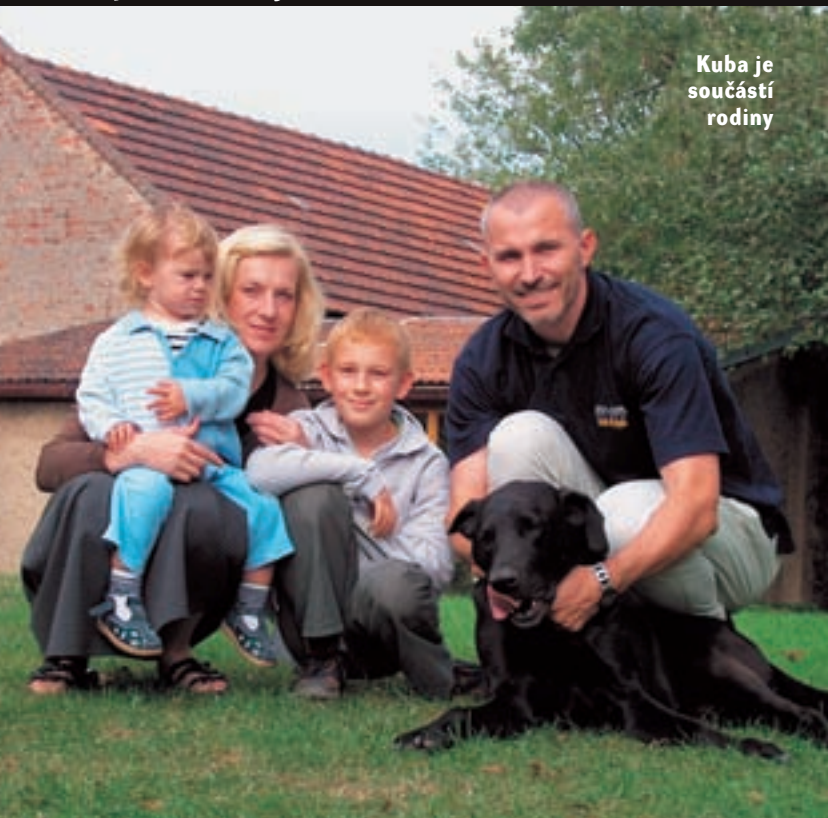
Kuba je součástí rodiny