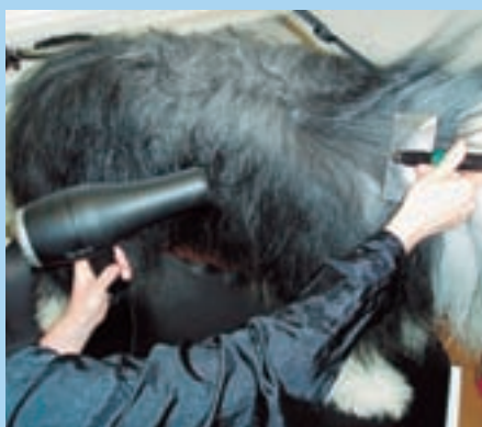
Použití ručního fénu na vlasy

cujeme jemně, aby nedošlo k poškrábání a poranění kůže. Stane-li se, že některé místo samo uschne dřív, než se k němu dostaneme, je dobré mít po ruce plasto- vou láhev s čistou vodou a rozprašova- čem a srst postříkat, aby se opět namo- kčila a my abychom ji mohli okamžitě vyfénovat. Jen dobře ostříhanou a vyfou- kanou srst lze kvalitně ostříhat!