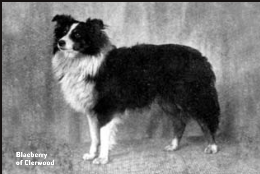
Blaeberry of Clerwood