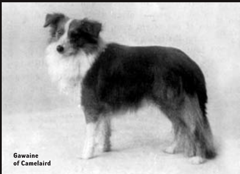
Gawaine of Camelaird

Britská asociace chovatelů šeltií, The British Shetland Sheepdog Breeder's Association, s hrdostí konstatuje, že první standard plemene byl navržen již v roce 1898 a potvrzen v roce 1910. Od té doby nebyl v podstatě měněn a dá se říci, že šeltie roku 1900 zůstává ideálem i pro současnost. U příležitosti třiceti let od vypracování standardu zveřejnila asociace galerii nejúspěšnějších jedinců, šampionů první čtvrtiny 20. století.