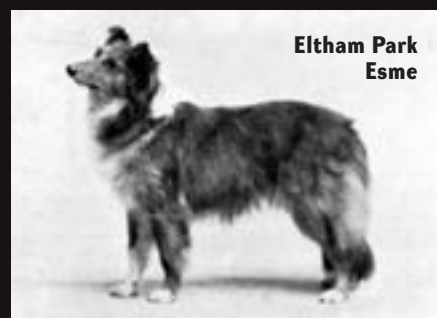
Eltham Park Esme