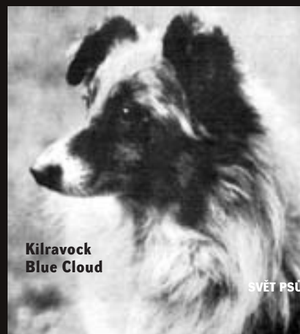
Kilravock Blue Cloud