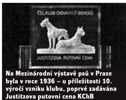
Na Mezinárodní výstavě psů v Praze byla v roce 1936 – u příležitosti 10. výročí vzniku klubu, poprvé zadávána Justitzova putovní cena KChB

kého důvodu, který by ho mohl zvrátiti, neboť to, co p. lesní správce o psu řekne, je přímo svaté. Proto ti, kteří to nejenom se psem, ale i s celou kynologií myslí upřímně, mají ho také upřímně rádi a těm také je náš jubilant opravdovým přítelem, učitelem a rádcem.“