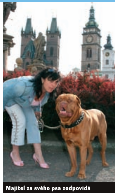
Majitel za svého psa zodpovídá

● Psovod je povinen na veřejném prostranství s možností volného pohybu psů vést psa na vodítku, nachází-li se v okruhu méně než 50 m od psa jiná osoba (s výjimkou osob dohodnutých s psovodem jinak).