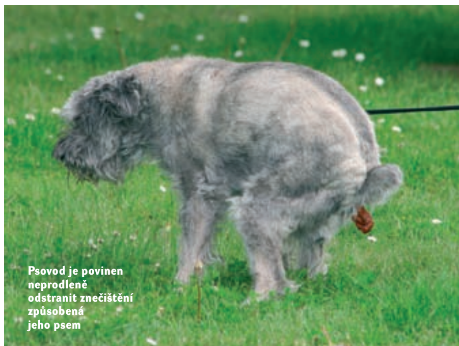
Psovod je povinen neprodleně odstranit znečištění způsobené jeho psem

d) přivádět nebo přinášet psy na dětská hřiště, hřbitovy, květinové záhony, písčoviště, plochy pomníků, plochy veřejné zeleně na náměstích, sportoviště, venkovní umělé vodní plochy (fontány) a na místa opatřená upozorněním na zákaz vodění psů.“