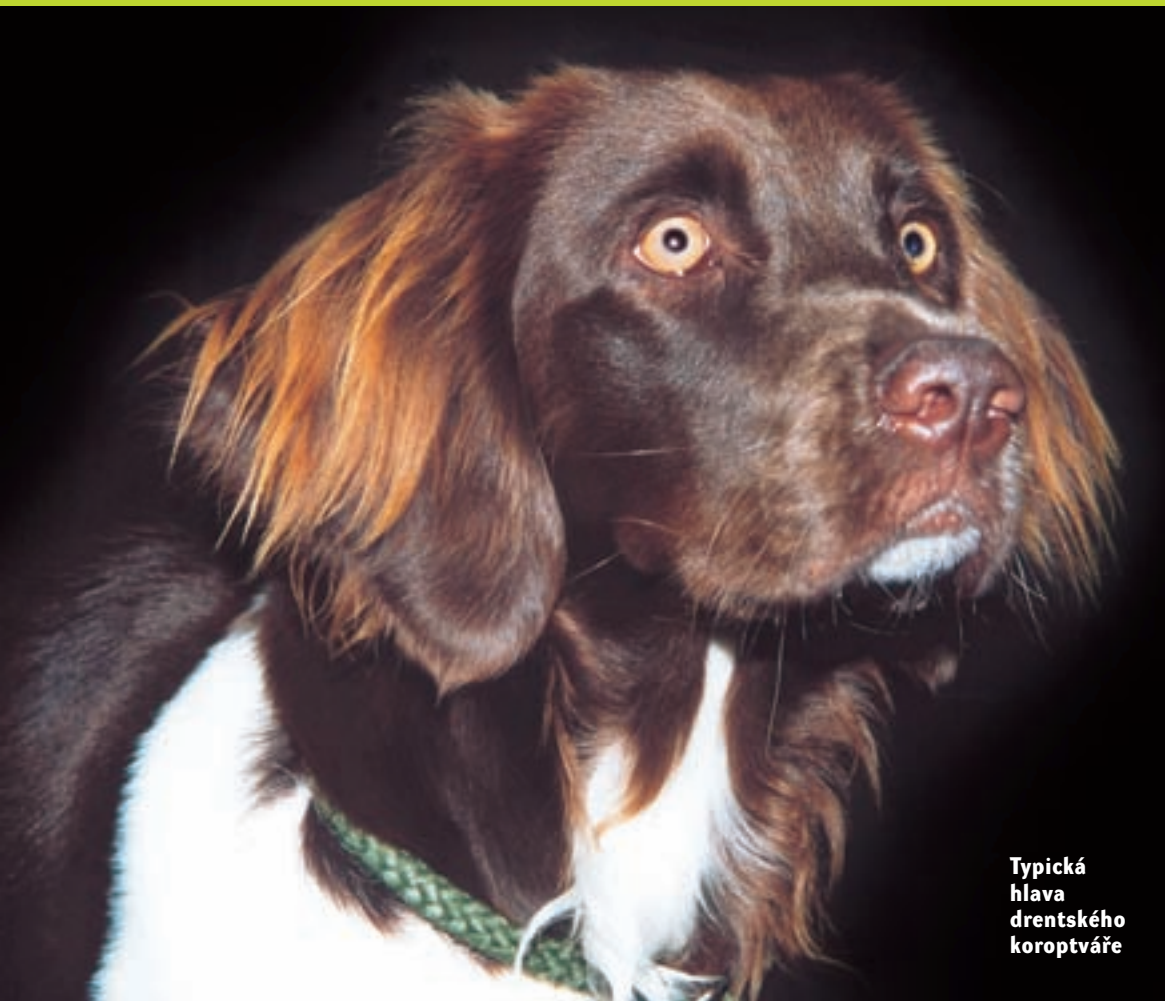
Typická hlava drentského koroptváře