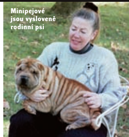
Minipejové jsou vysloveně rodinní psi

46 centimetrů a mohou dorůst až 51 cm. Malou velikost minipejů prý má na svědomí recesivní gen, jenž si tento pes nese ve své genetické výbavě. Chovatelé se snaží minipeje typově stabilizovat. Americký minipej se může vyskytovat ve třech druzích srsti. Buď má srst úplně krátkou (tzv. „horse coat“ neboli koňská srst), nebo dosahující délky až 2, 5 centimetrů („brush coat“, kartáčovitá srst), případně delší než 2,5 centimetrů („bear coat“, medvědí srst). Přednost se ovšem jednoznačně dává dvěma kratším typům srsti, zvláště u zvířat určených pro výstavy a do chovu.