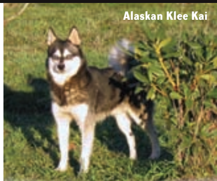
Alaskan Klee Kai