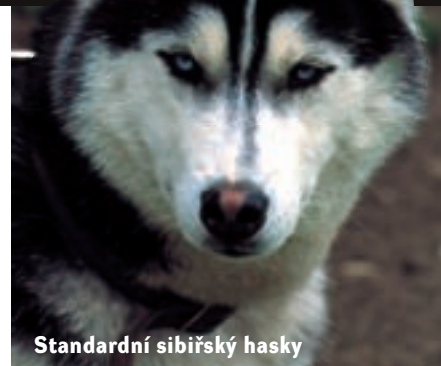
Standardní sibiřský husky

ket“ biglové jsou podvodem na koupěchtivé laiky bažící po raritách, nebo seriózním plemenem. To první tvrdí zástupci chovatelů standardních biglů. Ti se v USA chovají ve dvou velikostních rázech: standardním do 40 cm v kohoutku a malém o velikosti kolem 33 cm v kohoutku. Pokud někdo nabízí bigly výrazně menší, svědčí to podle mnoha chovatelů o neserióznosti. Taková zvířátka prý mívají slabé kosti, vystupující oči a zkrácené nosíky, což sice možná vypadá roztomile, ale je to příznakem nezdravé miniaturizace a případných možných zdravotních problémů. Americký klub chovatelů biglů tvrdí, že „taková věc jako moderní kapesní bigl neexistuje“ a že název kapesní bigl je „značkou špatné kvality, označuje zvířata určená pro obchod“.