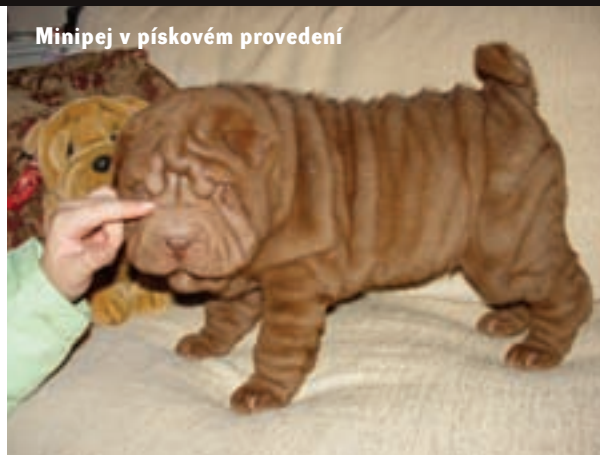
Minipej v pískovém provedení