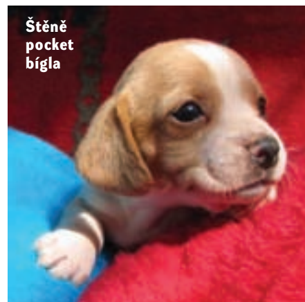
Štěně pocket bigla