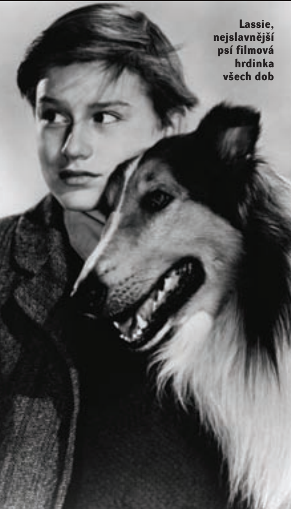
Lassie, nejslavnější psí filmová hrdinka všech dob