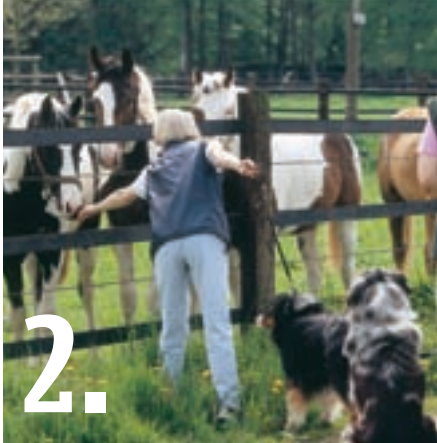
Obrázek 2: Koně!

To, co nejednoho člověka na procházce uvede do stavu radostné blaženosti, může být pro psa být maximálně stresující. Zvláště když se s obrovskými kopytníky setká poprvé, můžete najisto počítat s prudkou reakcí. Podle individuálního charakteru psa se může dostavit buď panický úprk, nebo naopak štěkot a vrčení, co hrdlo ráčí. Že by nějaký pes koně prostě ignoroval, nebo se k nim dokonce choval přátelsky, k tomu dochází jen zřídka.