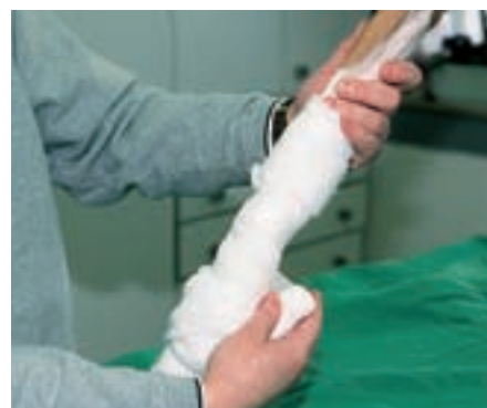
Obvazová vata a gázové obvazy stabilizují poraněnou končetinu do příchodu veterináře