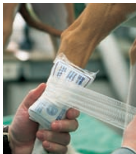
Tlakový obvaz fixujeme gázovým obvazem

Potom polštářky jednou rukou pevně přidržíte a vatu přikládáte svisle podél tlapky. Tento postup několikrát opakujte, dokud nebude obkládání tlapky stabilizováno ještě vodorovným omotáváním. Nyní sterilní čtverce oviňte elastickým obinadlem a tím efektivně fixujte. Obvaz nesmí být zavázán příliš pevně, aby neovlivňoval krevní oběh, nesmí být ale ani tak volný, aby sklouzával. Proveďte test prsty: obvaz sedí správně, pokud se mezi