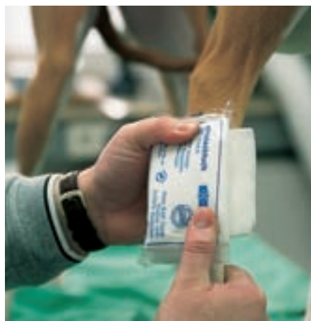
Tlakový obvaz pomůže rychleji uzavřít krvácející rány. V tomto případě můžeme použít také kompresivní nebo nějaký jiný stabilní předmět.

zem k sobě budou tvořit otlaky. Pokud má pes drápy na palcích, musí být obloženy i ony. Nyní tedy obkládáme tlapky i celou končetinu až po zápěstí a hlezno vatovým sterilním krytím. Vrstvy této vaty se nejprve několikrát obtočí vodorovně kolem nohy.