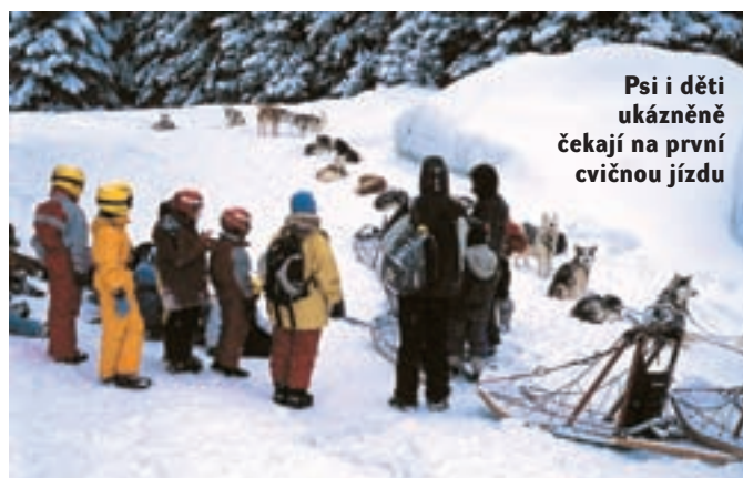
Psi i děti ukázněně čekají na první cvičnou jízdu