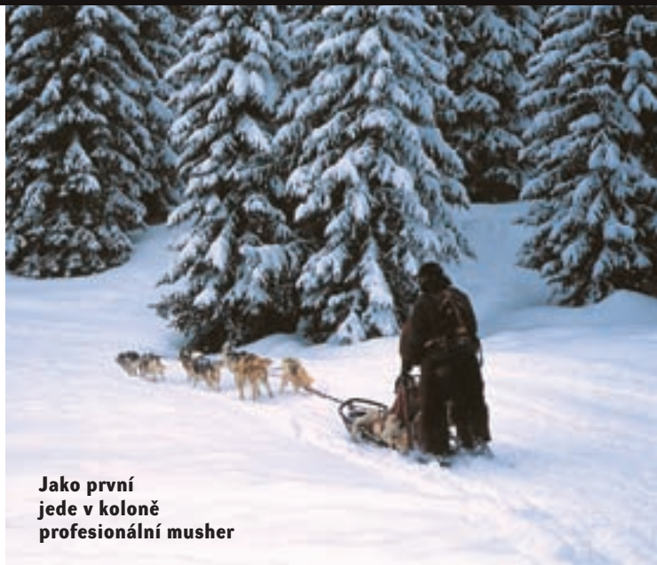
Jako první jede v koloně profesionální musher