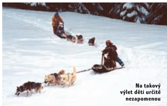
Na takový výlet děti určitě nezapomenou