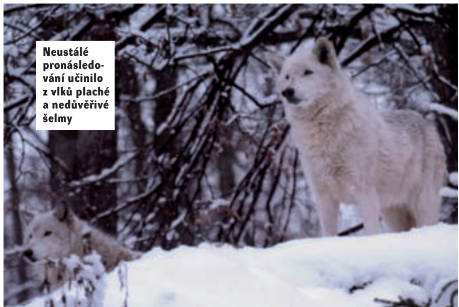
Neustálé pronásledování učinilo z vlků plaché a nedůvěřivé šelmy