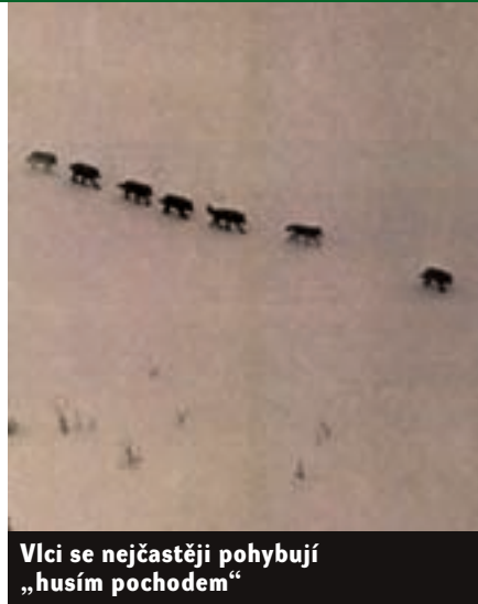
Vlci se nejčastěji pohybují „husím pochodem“

Zahlédnout vlka ve volné přírodě je pro milovníka divočiny výhrou v loterii. Sledovat na vlastní oči lov vlčí smečky se rovná téměř zázraku. Terénnímu zoologu a výtvarníkovi Ludvíku Kuncovi se to v Západních Tátrách na Slovensku v září za jelení říje podařilo: „Hned po příchodu (na skalní hřeben - pozn. aut.) jsem propátral dalekohledem každou loučku, zda neuvidím jelena nebo laně. Tentokrát jsem zjistil, že jsem to já, kterého se zájmem pozoruje velký vlk. Ležel na skalní terase. Byl ode mě asi 800 metrů, cítil se zcela bezpečně. Díky výbornému dalekohledu jsem si ho mohl i já dobře prohlédnout. Občas se podíval i dolů do hlubokého řečiště, které leželo pod ním dobrých 400 metrů. Horský potok zde překonával, až sem nahoru se ozývalo jeho hřmění. Čas ubíhal a propátrával další části závěru horského údolí. Byla stále lepší a ostřejší viditelnost. Až posléze jsem zjistil, že vlk není sám. V dosti značné vzdálenosti a asi o 100 až 150 metrů výše byli tři další vlci. Postávali, vrtěli oháňkami a chvílemi se očichávali - bylo patrné, že se k něčemu chystají. Náhle se vějířovitě rozeběhli ze svahu. Dole pod nimi vyrazila z kleče laně. V dosti značné vzdálenosti jí v patách uháněl další, už pátý vlk. Záměr měli vlci jasný,