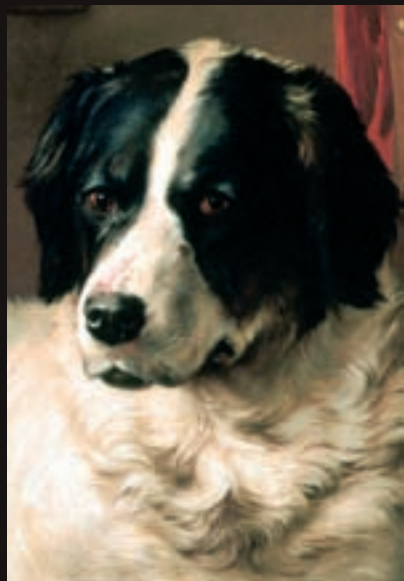
Novofundlandský pes, nebo landseer? Polovina 19. století