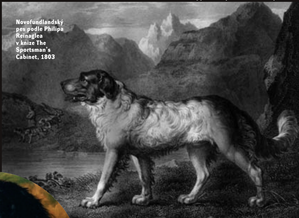
Novofundlandský pes podle Philipa Reinaglea v knize The Sportsman's Cabinet, 1803