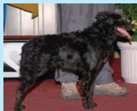
Mudi je i ostrážitý hlídač

Původní uplatnění vyžadovalo psa odvážného, proto psi tvrdšího charakteru nejsou výjimkou. Při setkání většího počtu psů může mudi zapříčinit šarvátku. Proto je u štěňat nezbytná socializace a možnost kontaktů s jinými psy i jinými druhy zvířat. Pro budoucí láskyplný vztah k člověku je důležitá péče o štěňátka v nejužším kruhu rodiny.