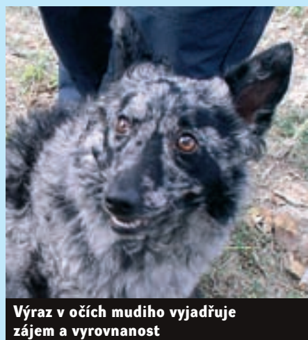
Výraz v očích mudiho vyjadřuje zájem a vyrovnanost