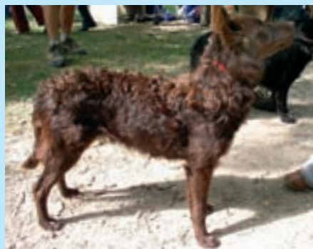
Méně časté je hnědé zbarvení – tito psi mají hnědou srst i hnědou nosní houbu

Mudi je temperamentní ovčák plný energie s výraznou osobností, šarmem a chutí do práce. Pastevci potřebovali nejen psa vytrvalého, ale i inteligentního, který dokáže předvídat chování a včas se vyhnout úderu dobytčích nebo koňských kopyt. Takový pes neměl mnoho příležitostí a musel se rychle učit. Další příležitost pro něj mohla skončit s tragickými následky. Práce však pro něj zahrnutím zvířat do bezpečné ohrady nekončila. Mudi je také vynikající a ostrážitý hlídač obydlí. Je velice přizpůsobivý a jeho srst mu umožňuje pracovat v jakémkoliv prostředí. Lze jej chovat venku i v bytě, pokud mu dopřejete patřičné zaměstnání. Je vhodný pro všechny, kterým se líbí a touží po psovi s delší srstí. Při její úpra-