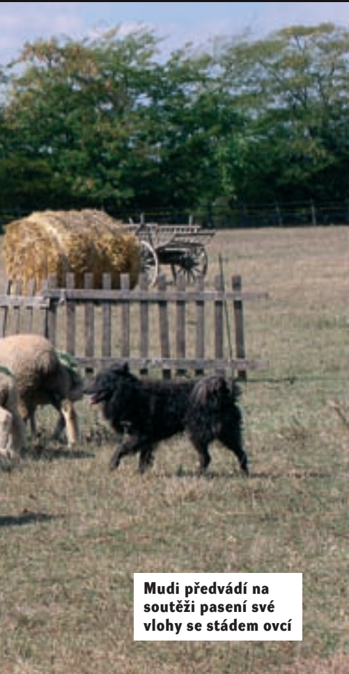
Mudi předvádí na soutěži pasení své vlohy se stádem ovcí

uznala mudiho za samostatné plemeno a označila je číslem standardu 238. Po uznání plemene a jeho propagaci vzrostl o mudiho zájem nejen mezi pastevcí. Svě místo našel i na vesnických statcích, kde svou přítomností odrazoval od nevídaných návštěv lišky a lovil všudypřítomné potkany. Dodnes patří mezi nejlepší hlídače obydlí. Bez jeho vědomí se k domu nikdo nepřiblíží. Velký rozvoj plemene nastal v 80. letech minulého století. Největší uznání se přisuzuje propagátorovi plemene panu Zsírosovi, který se s největší péčí snaží udržet plemeno duševně i tělesně zdravé dodnes. Jeho podíl na vývoji plemene je tak velký, že dnes téměř nenajdete mudiho, který by neměl v rodokmenu alespoň jednoho, ne-li více z jeho odchovů. Bohužel málopočetnost plemene i v rodné zemi vede některé chovatele k příbuzenské plemenitbě, která se občas projeví jemností v celkové stavbě těla.