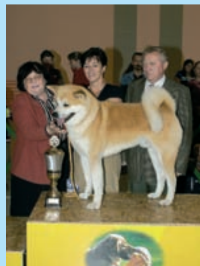
Nahoře: Vítězným psem druhého dne výstavy (BOD) se stal vítěz skupiny V..