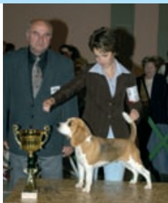
VI. Bígl Starbuck Torbay Ring Amulet, maj. A. Čančíková