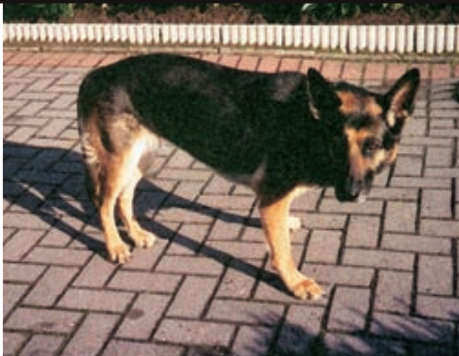
Před léčbou se u Tietke projevovale vpravo vzadu zchromnutí středního stupně, tlapy pánevních končetin přesahovaly přes středovou linii. Drápy pánevních končetin byly silně opotřebované šoupáním po zemi. Vpředu Tietke vytáčela lokty a zatěžovala především levou hrudní končetinu.