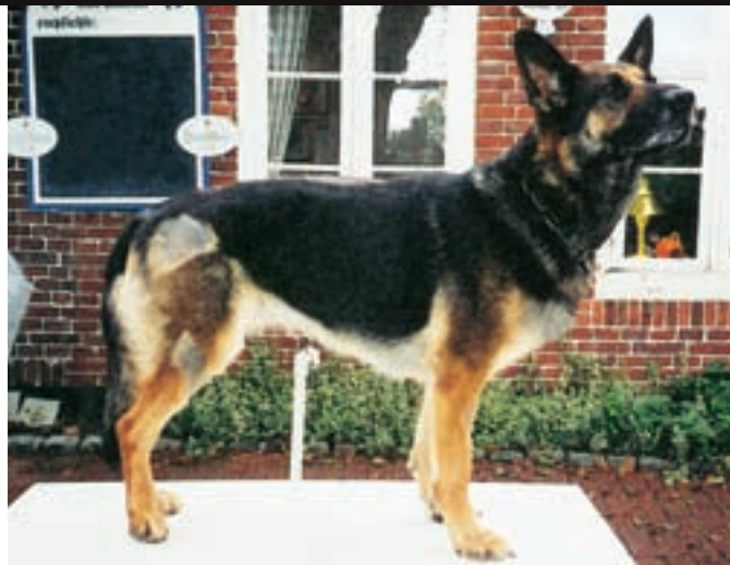
Po léčbě nastalo výrazné zlepšení. Fenka zvedala tlapy výš a kladla je širě, přestala tolik vytáčet lokty. Pomalým, ale stále se rozšiřujícím tréninkem se nyní musí znovu vybudovat svalstvo, které zakrnelo v důsledku šetření pánevní končetiny. Výsledkem bude zpevněný pohyb.