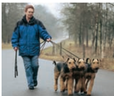
Dnes však žijí erdelteriéri převážně jako rodinní psi

Pod krycí srstí je měkká, hebká podsada. Ta je kratší a nabízí efektivní ochranu před chladem a vlhkostí.