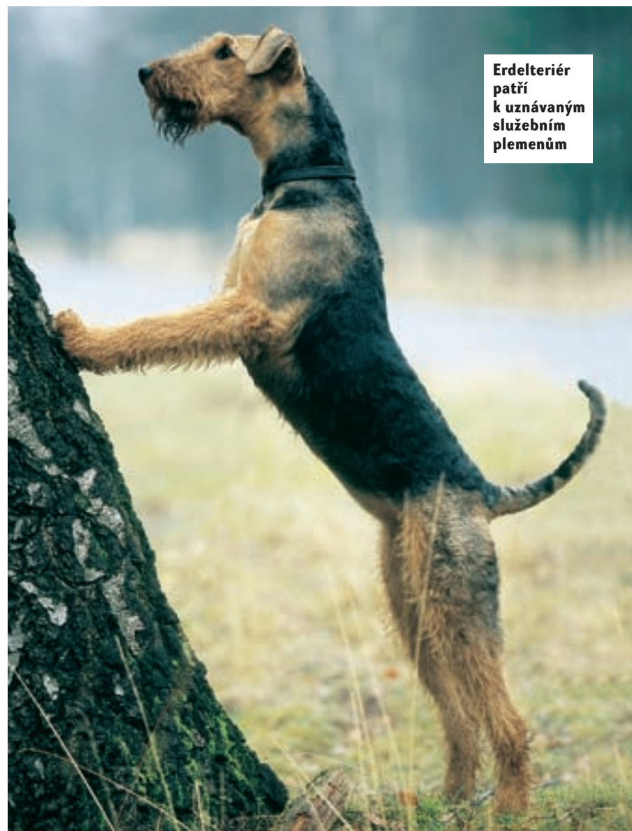
Erdelteriér patří k uznávaným služebním plemenům

domu majitele, jsou bdělí a ostražití. Dobrý, ale nijak přehnaný ochránářský instinkt je psům tohoto plemene vrozený. Pokud někdo žije na samotě, svého odvážného společníka skutečně ocení.