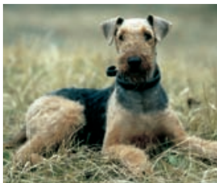
Původně byl chován k loveckým účelům

Řada lidí považuje vzhled erdelteriérů za vysloveně elegantní. Další kladný bod: tito psi nelínají - předpokladem ovšem je, že jejich srsti věnujeme odpovídající péči. Erdelteriéri jsou drsnosrstí a mají tvrdou krycí srst tvrdostí připomínající dráty.