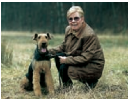
Erdelteriéři jsou snášenliví a nekomplikovaní psi

všech oblastech se u něj projevují vynikající vlohy a schopnosti a vyslovená ochota podávat skvělé výkony. Jako terapeutičtí psi projevují erdelteriéři citlivost a schopnost vcítit se.