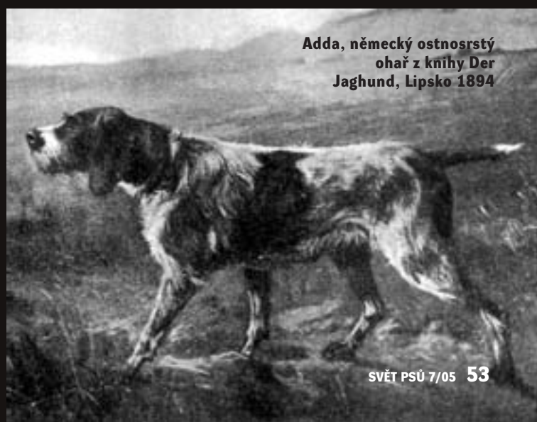
Adda, německý ostnosrstý ohař z knihy Der Jaghund, Lipsko 1894