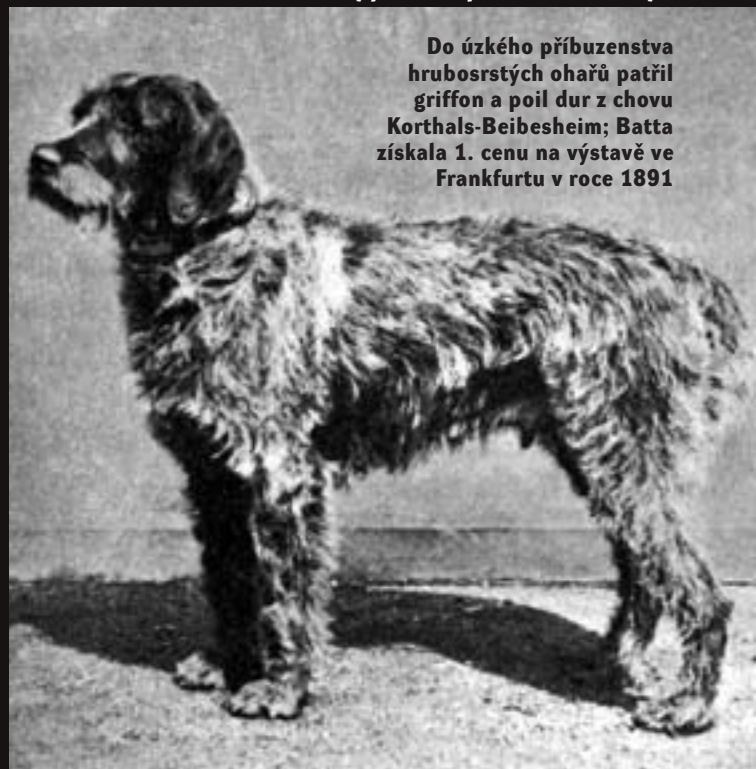
Do úzkého příbuzenstva hrubosrstých ohařů patřil griffon a poil dur z chovu Korthals-Beibesheim; Batta získala 1. cenu na výstavě ve Frankfurtu v roce 1891