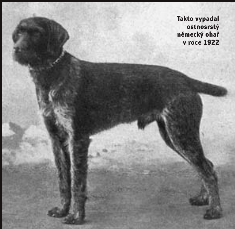
Takto vypadal ostnosrstý německý ohař v roce 1922