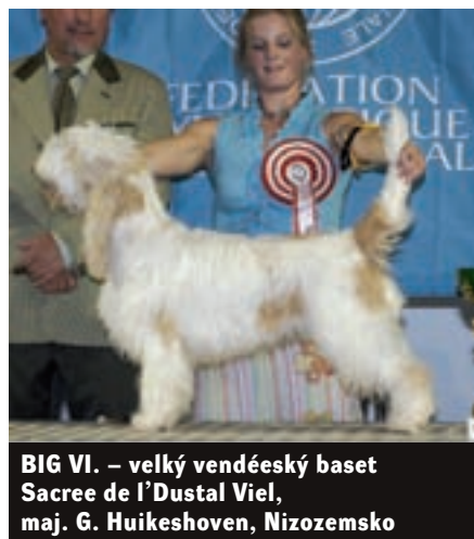
BIG VI. – velký vendéeský baset Sacree de l'Dustal Viel, maj. G. Huikeshoven, Nizozemsko