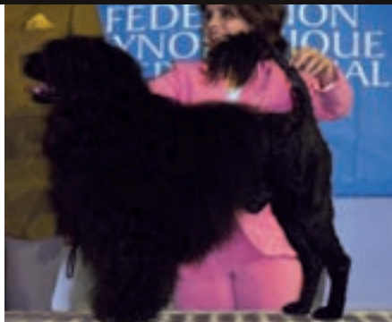
BIG VIII. – cao de aqua Smooth da Pedra da Anixa, I. Santos, Portugalsko