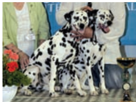
Nejlepší pár 2. dne, dalmatini By Mediolanum ze Srbska – Černé Hory