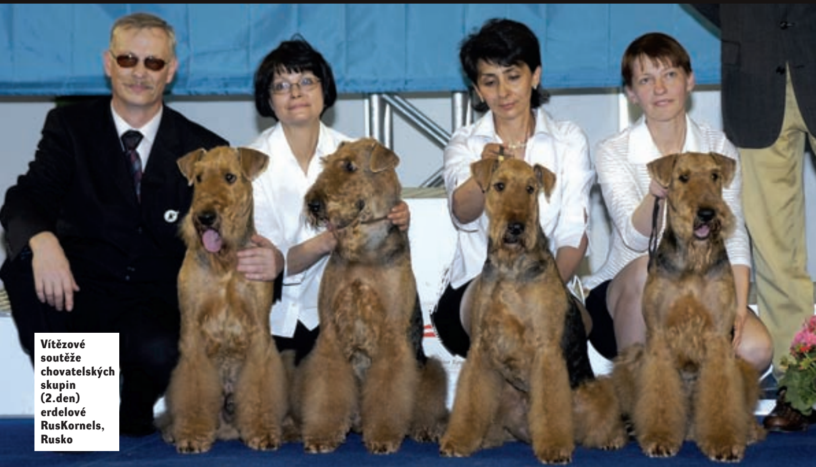
Vítězové soutěže chovatelských skupin (2.den) erdelové RusKornels, Rusko

nepřekvapily přes dvě stovky přihlášených u labradorských a zlatých retrívrů, jorkšírských teriérů nebo dobrmanů, u jiných byly jasným příznakem nadcházející módy. To je případ dvou relativně nedávno nově uznaných plemen: australských ovčáků (75) a zvláště pak krátkonohých Jack Russell teriérů a jejich obdoby s delšíma nohama parson Russell teriérů. Těchto teriérů dohromady bylo kolem stovky a davy lidí kolem jejich kruhů dávaly tušit, že zájem veřejnosti o ně je na vzestupu. Ostatně jeden z „russellů“ nakonec vyhrál i celou finálovou skupinu teriérů a nebyl bez šance ani v bojích o titul nejkrásnějšího psa výstavy.