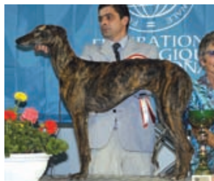
BIG X. – španělský galgo Copla de Calathea, maj. J. Camera Cardita, Portugalsko

Na druhé straně spektra pak byla plemena, která se sjela ve stovkách. U některých jsme na velké počty zvyklí, zvláště proto