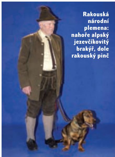
Rakouská národní plemena: nahore alpský jezevčíkovitý brakýř, dole rakouský pinč