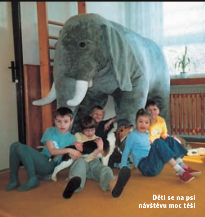
Děti se na psí návštěvu moc těší