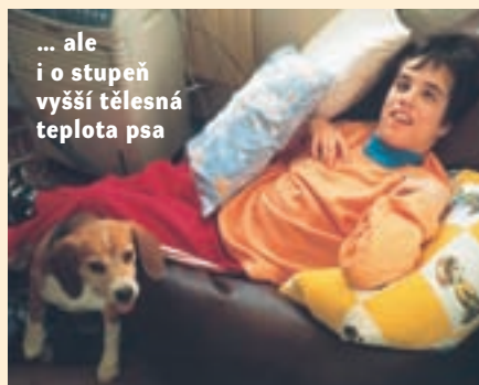
... ale i o stupeň vyšší tělesná teplota psa