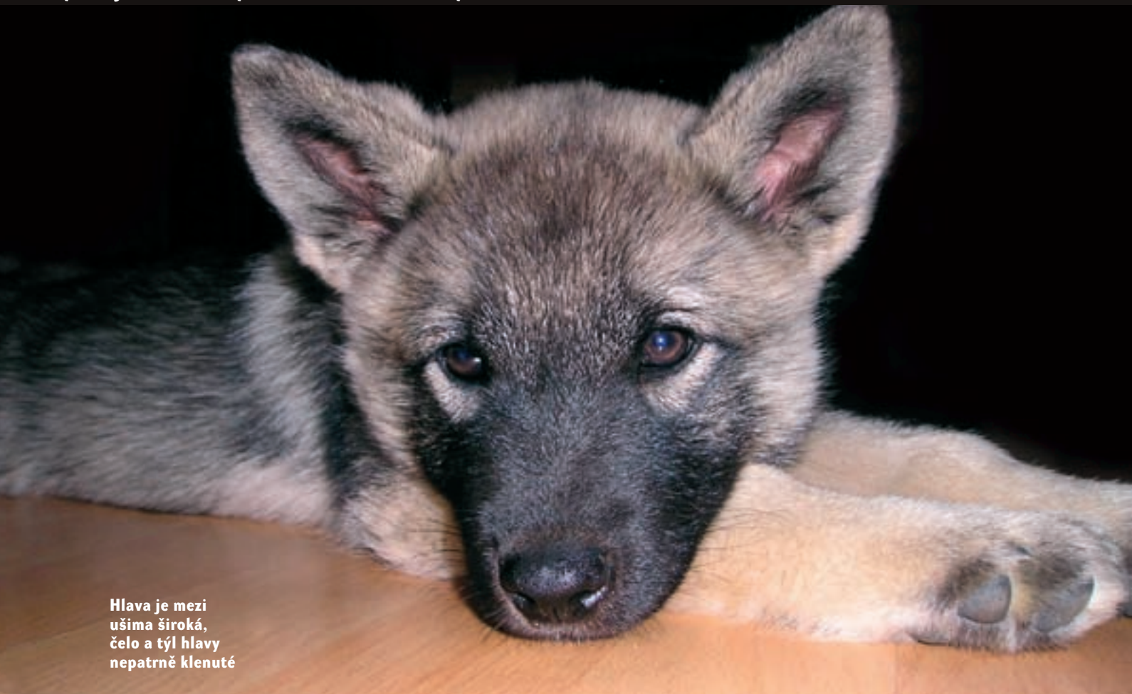
Hlava je mezi ušima široká, čelo a týl hlavy nepatrně klenuté

ní přírůstky štěnat NLS se pohybují v rozmezí od 1 do 1,5 tisíce. Okolo 700 jedinců bývá ročně vystavováno a zhruba 300 se zúčastní loveckých pracovních zkoušek.