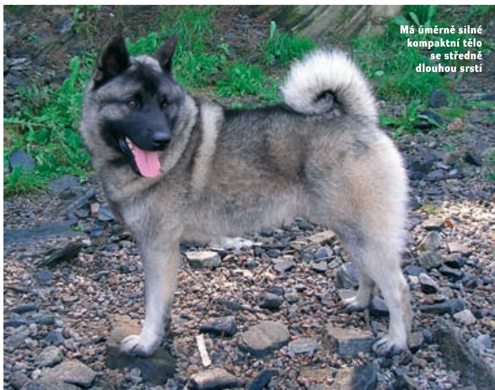
Má úměrně silné kompaktní tělo se středně dlouhou srstí

padosibiřská lajka - 413 a východosibiřská lajka - 326. Roč-