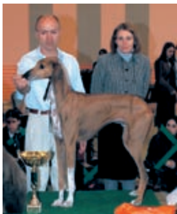
X. Azavak Ahmar Kel-Es-Suf, maj. P. Štěpánek