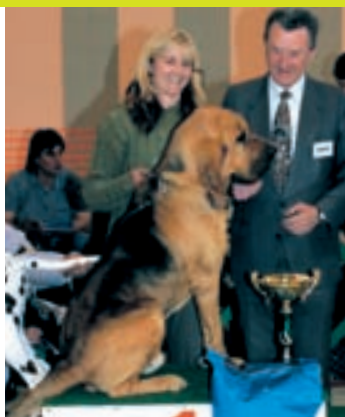
VI. Bladhaund Aljoscha Roborovski, maj. J. M. Svobodová