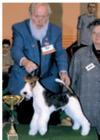
III. Foxteriér hrubosrstý Gustav v.d. Schönen Bergen, maj. D. Nolting Schmitz