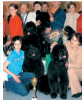
Chov. skup. (ne): novofundlandský pes Faundland, chov A. Polgar