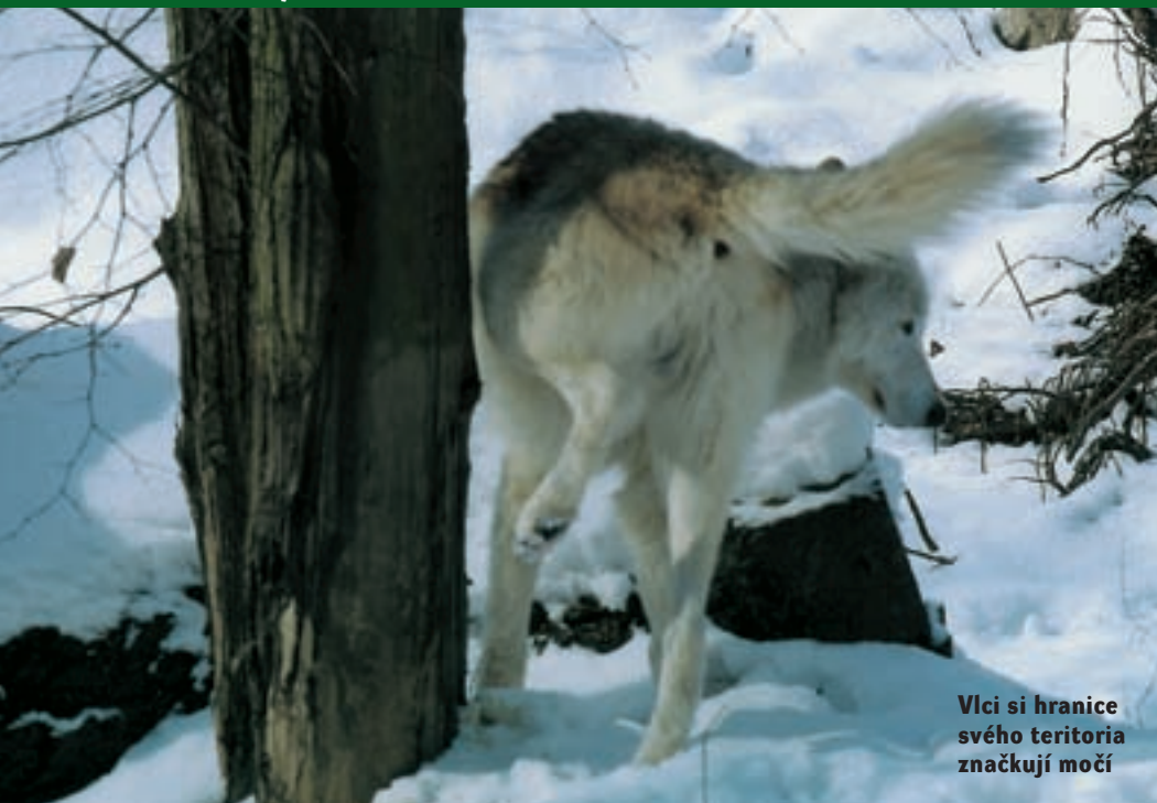
Vlci si hranice svého teritoria značují močí

nebo vážného zranění. O budoucím osudu vlka omega rozhoduje jeho dosavadní život - pokud zneužíval v minulosti dominantního postavení, budou mu po pádu z trůnu ostatní členové smečky minulé příkoří oplácet. Pokud byl dobrým, bude s ním i smečka zacházet dobře a laskavě. Při chovu vlčí smečky v zajetí však na tom omega vlci nebývají dobře. Byť sebevětší ohrada je malá a nepřirozená a vlčí vydědění nemají úniku. V přírodě zvíře omega sleduje smečku z určité vzdálenosti, živí se zbytky kořisti a příležitostně se pokouší ke smečce připojit. Smečka může omegu i na nějaký čas přijmout zpět do svého středu, třeba při konfliktu s cizím vlkem, nebo jej může znovu začlenit zpět. Při chovu v zajetí se však vlk omega může stát terčem odražení frustrace vlčí smečky a může dojít i k jeho usmrcení, o čemž svědčí případy z mnoha zoologických zahrad.