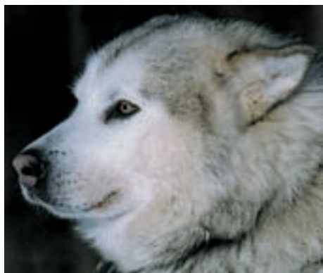
Na Aljašce jsou malamuti považováni za „kopie“ vlků