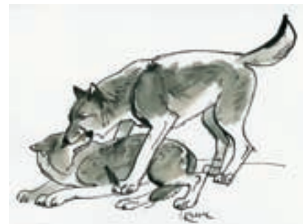
Stojící vlk stisknutím čenichu trestá níže postaveného jedince

Jak už jsme naznačili na jiném místě našeho seriálu, vlci svoje teritorium (ať již stálé, nebo dočasné) označují pachovými značkami (močí) a vokálně (vytím), čímž jasně dávají najevo, že mají ke svému úze-