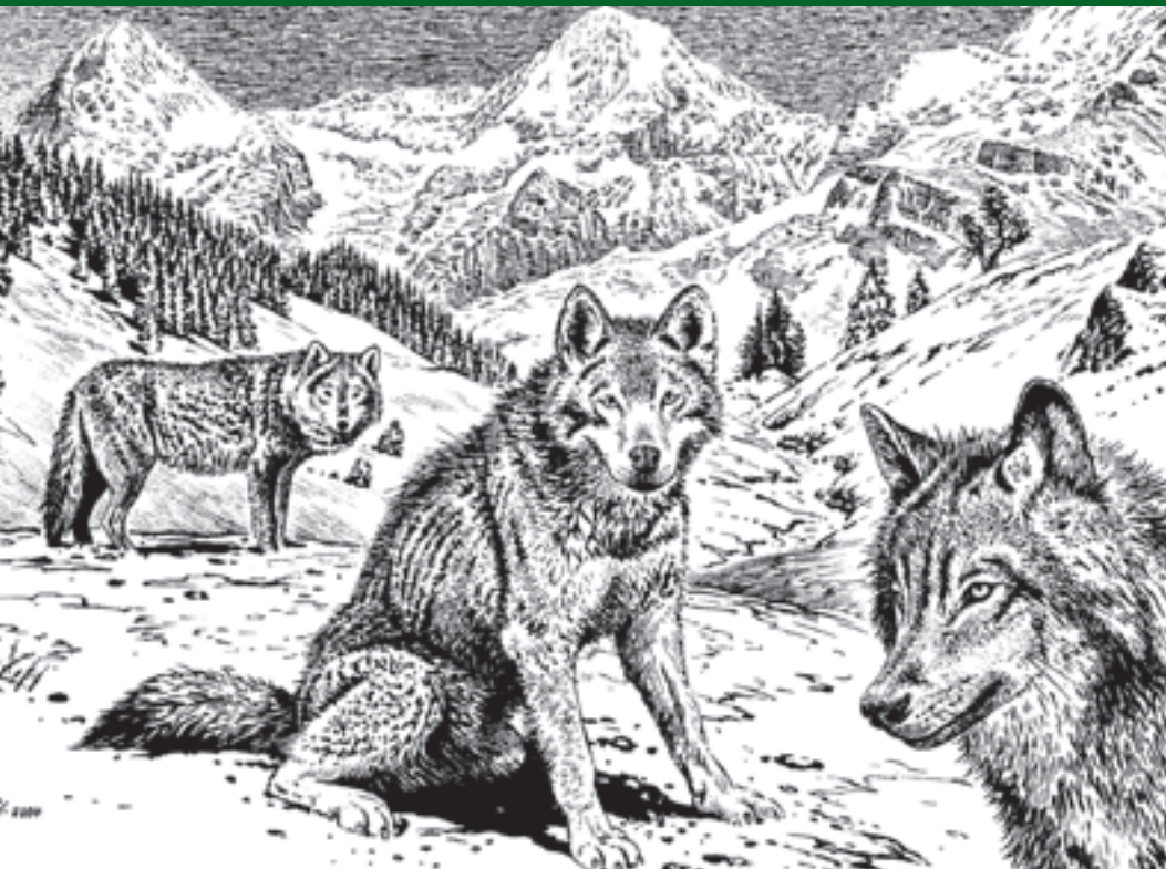
Ve vlčí smečce panuje přísná, leč nikoliv neměnná společenská hierarchie

Vlčí řeč je složitým ritualizovaným jazykem plným gest, imponujících a podřízených postojů, zježených chlupů na šíji, postavení ocasu, nakrčení čenichu a odhalení tesáků, kradmých i „dlouhých“ pohledů, postavení uší, olizování, uchopení za čenich (varování či malý trest), vylizování koutků úst druhu (symbolické juvenilní chování prosby či žebrání o potravu = v dospělosti podřízené a uklidňující gesto)... Ke komunikaci vydávají vlci celou škálu zvuků - výhružné vrčení vymezuje mocenskou pozici ve smečce. Varovné vyštěknutí varuje ostatní členy smečky před hrozcím nebezpečím. (Vlci nikdy neštěkají jako psi, v jejich hlasovém projevu souvislý štěkot chybí. V jejich projevu jde pouze o „udivené“ nebo varovné vyštěknutí; štěkot se u psů vyvinul až jako důsledek /a projev/ domestikace.) Naříkavé kňučení mláďat přivolává matku... A samozřejmě legendární vlčí výtí, které varuje sousedící smečky, svolává vlky k lovu, upevňuje soudržnost, ale může i vyjadřovat pocity, informace, nálady... (Kdykoliv uvažuji o vlčím zpěvu - výtí - automaticky mi na myslí vytane nádherný verš z básně Charlese Simice: „Ten, kdo neumí výt, nenajde svoji smečku.“) Samozřejmě že v celkovém výčtu nemůžeme zapomenout ani na dosud málo prozkoumanou pachovou komunikaci - na značení močí a trusem a sekrecí vlčích žláz.