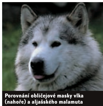
Porovnání obličejové masky vlka (nahore) a aljašského malamuta

v 19. století poměrně běžné v severovýchodní Evropě a v centrálním Rusku. Největší vlčí smečka, o které máme autentické zprávy z pozorování seriálních vědců, byla zaznamenána na Aljašce - tvořilo ji šestatřicet vlků. /Naproti tomuto faktu vytvářejí dlouhové ( Cuon alpinus ) - ryšaví asijské divoké psi - často více než čtyřicetičlenné smečky, jak si výstižně povšiml a ve svých Knihách džunglí popsal již Rudyard Kipling./ (Fámy o stovkách či tisících vlků plenících zimní krajinu jsou ovšem výplodem choré a strachem zjitřené lidské fantazie. Ani o takové rádobě pravdivé zprávy není v historii nouze: James O. Pattie píše v roce 1824 zprávu o potlačení vlčí smečky na své cestě do Santa Fé: „Usoudili jsme, že jich bylo (pozn. aut.: rozuměj vlků) nejméně tisíc. Byli velcí a bílí jako ovce.“ )