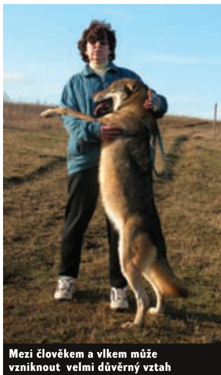
Mezi člověkem a vlkem může vzniknout velmi důvěrný vztah

Československé vlčáky lze rovněž cvičit a dosáhnout s nimi velmi dobrých výsledků. S výcvikem je však třeba začít co nejdříve, již od 2. měsíce věku, kdy už začínáme s nácvikem přivolání a aportu. Výcvikář by měl mít více zkušeností a postupovat uvážlivěji. Když se něco zkazí u vlčáka, trvá náprava velmi dlouho.