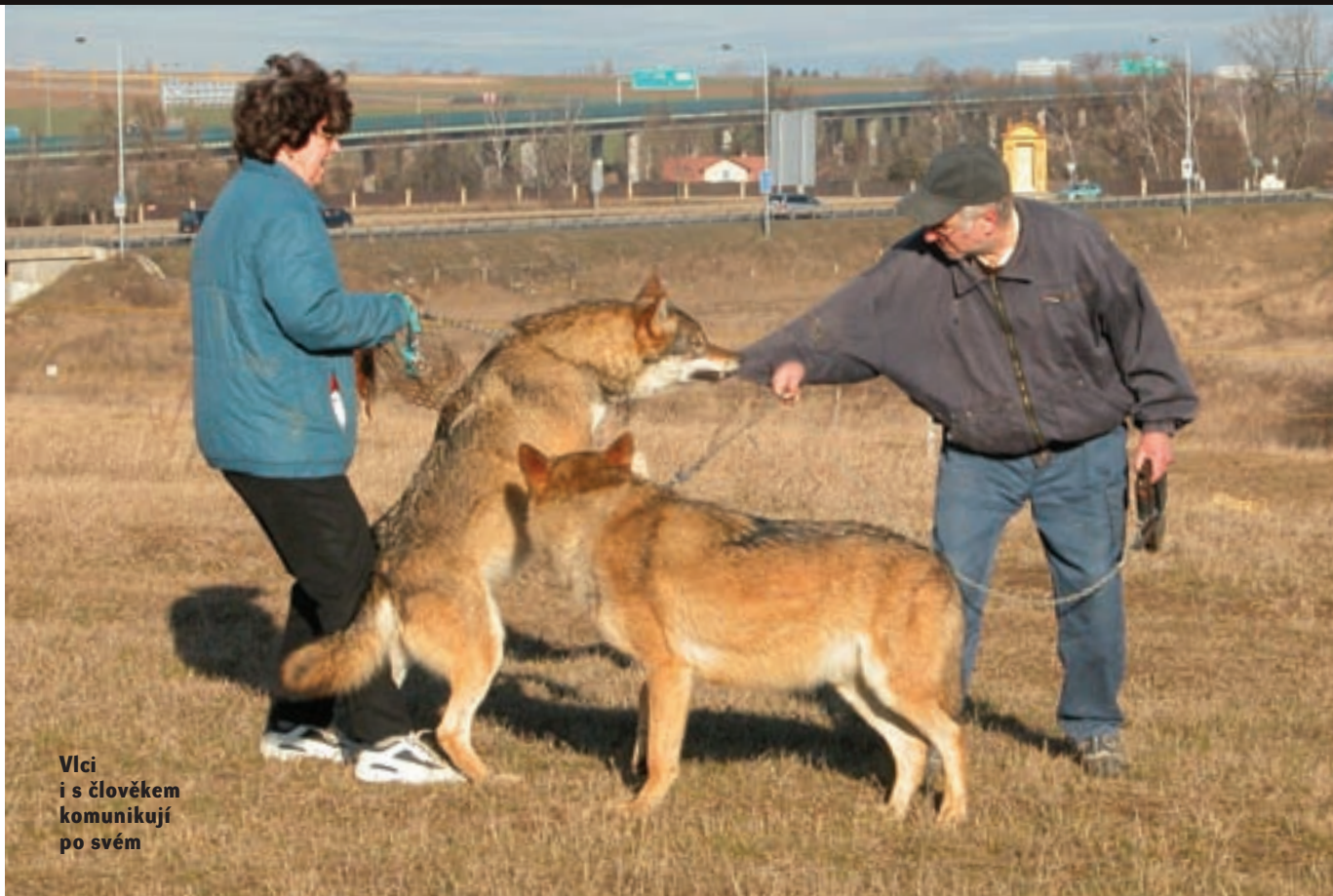
Vlci i s člověkem komunikují po svém

le a jejich socializace pokročila mnohem dál než u Elzy.