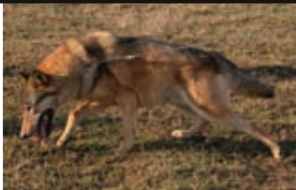
Stopy vlky nezajímají o nic méně než psy. Spíše naopak...