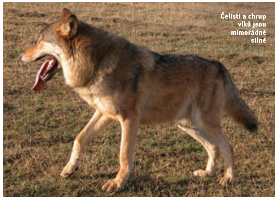
Čelisti a chrup vlků jsou mimořádně silné

s vlkem. Žádá si to obrovské zkušenosti, dobrou znalost zákonitostí vlčí smečky, spoustu času, nebojácnost a dobrou fyzickou kondici. A snad v prvé řadě: nekonečnou trpělivost. Co se pes naučí za pár minut, může vlkovi trvat několik dní nebo i týdnů. Ne proto, že by byl hloupější. Vlci jsou vysoce inteligentní zvířata, vědci už dávno změřili, že jejich mozek je výrazně větší než mozek domácích psů. Jsou to však také zvířata nesmírně ostražitá, bdělá a nedůvěřivá. Paměť mají lepší než pověstný slon. Zvláště negativní zážitky si zafixují na celý život. Na druhé straně vlci jsou schopni naučit se s člověkem na své úrovni dokonale komunikovat. Od člověka vyžadují totéž. Jen ten, kdo to zvládne, a ještě mu to bude přinášet radost a uspokojení, může pomýšlet na život mezi vlky. Tak jako maželé Andrlovi. Lea Smrčková