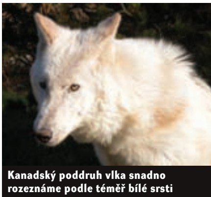
Kanadský poddruh vlka snadno rozeznáme podle téměř bílé srsti

způsobit se dokonce i pobytu ve městě. Celá smečka totiž bydlí na okraji Prahy, v poměrně husté zástavbě. Obrovská přízpůsobivost těchto vlků naznačuje, proč se právě z vlků vyvinulo nejoblíbenější domácí zvíře člověka.