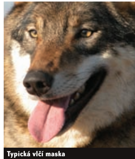
Typická vlčí maska

Zanedbatelné nejsou ani spotřeba krmiva a nároky na jeho kvalitu. Vlky nelze krmit granulami, potřebují maso s kostmi nebo celá krmná zvířata. I ke koupi výsekového masa už dnes musí být zvláštní povolení. Co je však při chovu vlků ještě náročnější než materiální zajištění, je způsob zacházení s nimi. Zdaleka ne každý, kdo dokáže vychovat psa, by totéž dokázal