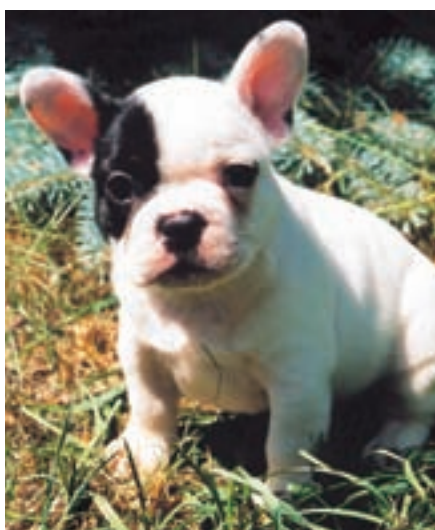
Tomuto štěňátku je právě pět týdnů

Předky měli všichni tito psi víceméně společné. Kdysi hodně dávno jimi byli hrůzostrašně vypadající, těžkopádní, podle dochovaných vyobrazení soudě poměrně nevábně vyhlížející tvorové používaní k lovu na medvědy. I díky nim byla postupně většina největších evropských šelem vyhubena. O uplatnění tím pádem ovšem přišli i jejich chrabří lovci. Za to, že tito psi nakonec nezmizeli z povrchu zemského, vděčí jinak nepřilíš obdivuhodné lidské kratochvíli - psím zápasům. Sveřepá a nebojácná povaha někdejších medvědobijců nalezla nové uplatnění v arénách i na jatkách s býky. Začalo se jim říkat říkat býkohryzové. Když byly krvavé zápasy s býky v Anglii v roce 1802 zakázány, nahradily obrovské bý-