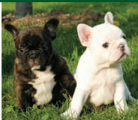
V jednom vrhu se běžně objevuje několik barev

Postupně rozruch kolem nich zase utichl, ale ze scény už nikdy úplně nezmizeli. Načas se znovu stali módními psy v období mezi dvěma válkami. Vaše babičky si