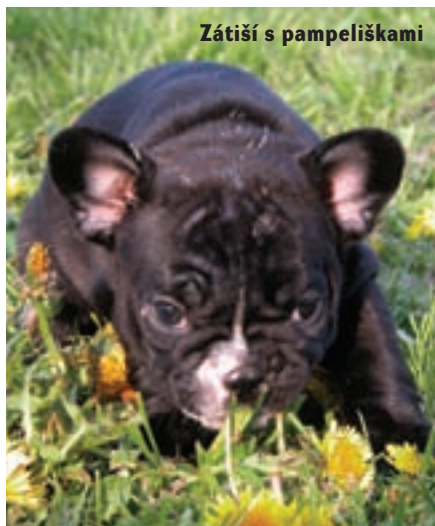
Zátiší s pampeliškami