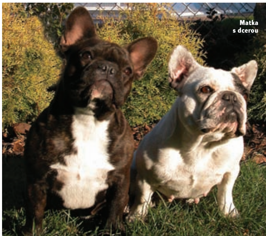
Matka s dcerou

I standard říká, že buldoček je sportovní pes. Má se pohybovat plným prostorovým pohybem, nesmí plést nohama a pohyb mu rozhodně nesmí činit obtíže. Bohužel právě s tím se na výstavách neznízdka setkáváme.