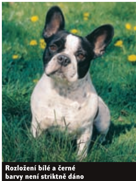
Rozložení bílé a černé barvy není striktně dáno

zde vypracovali první standard francouzského buldočka a plemeno tady zažilo doslova raketový start. Na dodnes nejprestižnější americké výstavě Westminster