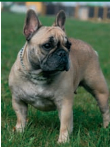
Varieta fawn neboli plavá byla uznána teprve nedávno

Buldoček je rád centrem veškerého dění. Pokud je rozmazlován v rodině, které už děti odrostly, nebo je dokonce svému pánovi jediným společníkem, umí být pořádně žárlivý a k cizím až nepříjemný. Dokáže se však také výborně začlenit do rodiny s dětmi. Na rozdíl od mnoha jiných subtilních společenských pejsků mu jeho masivní tělesná stavba umožňuje dobře se vyrovnat i s nároky menších dětí. Není křehký ani lekavý, a když mu děčko omylem šlápne na nohu nebo přes něj zakopne, nedělá z toho vědu. To samozřejmě neznamená, že bychom měli buldočka nechat malým dětem napospas.