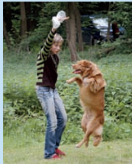
Tolleři jsou mimořádně aktivní, činorodí psi. Majitel se jim musí postarat o zábavu.

V překladu jeho název zní „retrívr z Nového Skotska lákající kachny“. Tím je řečeno mnohé. Tento maličký, ostatním jen vzdáleně se podobající retrívr údajně