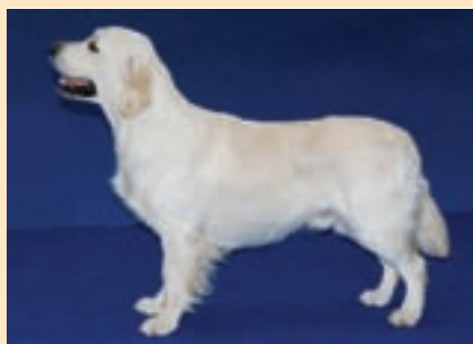
Zlatí retrívři patří k oblíbeným a oceňovaným výstavním psům

Slovo retrívř, v anglickém originálu retriever, bylo odvozeno od slovesa to retrieve = přinašet. Retrívř tedy česky znamená přinašeč, což vyjadřuje původní účel, ke kterému byli tito psi vytvořeni. Angličtí lordi věnující se lovu byli maximalisty. Od svých psů požadovali dokonalý výkon a byli přesvědčeni, že přílišná univerzálnost, ač ve zbytku Evropy převážně oceňovaná, kazí vlohy typické pro jednotlivá plemena. Protože držet si najednou plemen hned několik pro ně nebyl problém, zaměřili se na to, aby každé z nich bylo v něčem dokonalé. Od pointrů tedy žádali perfektní hledání a především vystavování, nechť jim „kazí styl“ tím, že by je nutili k práci po výstřelu a zvláště pak k aportování. Nemluvě o tom, že teplomilní pointři s krátkou srstí se třeba do chladné vody nevrhali zrovna s nadšením. To měli zpočátku za úkol různí psi, ale postupně došlo ke specializaci. Aportování dostala na starost nově formovaná skupina - retrívři. Jejich úkolem bylo zvěř dokonale přinést, to znamená jemně ji uchopit a dopravit ji do rukou střelce bez sebemenšího poškození, rychle