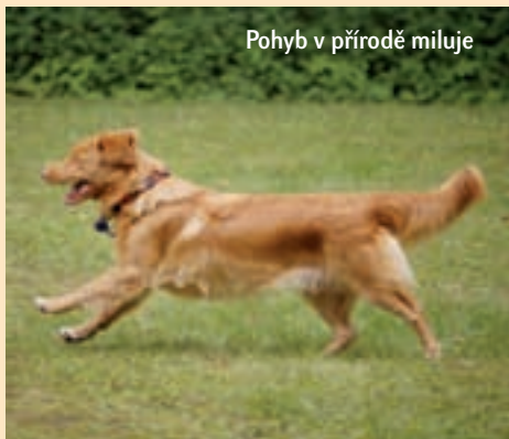
Pohyb v přírodě miluje

Dokončení příště: Labradorský retrívr, flat coated retrívr, curly coated retrívr