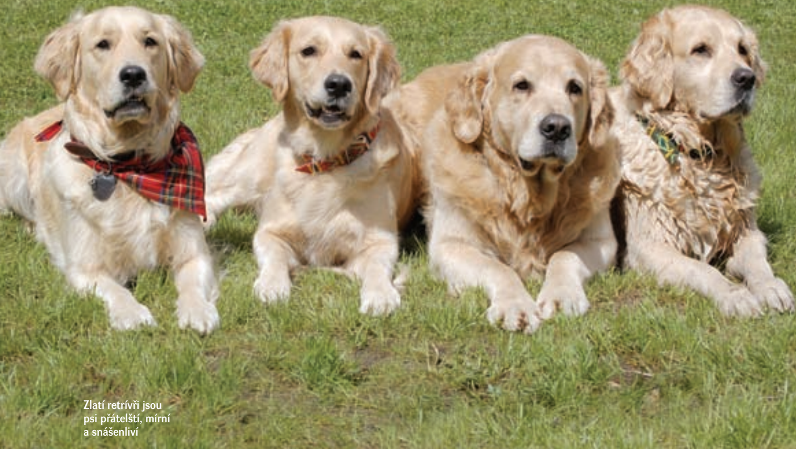
Zlatí retrívři jsou psi přátelští, mírní a snášenliví

zvířata se zvlněnou nebo přímo kudrnatou srstí. Postupně docházelo - převážně na území Velké Británie, ale nejen tam - k dalšímu rozrůzňování jednotlivých typů, a to i za přítomnosti cizí krve, až do podoby dnešních dobře rozlišitelných šesti plemen. Pět z nich je britských, Chesapeake bay retrívř pochází z USA a Nova Scotia duck tolling retrívř vznikl teprve v poměrně nedávné době v Kanadě.