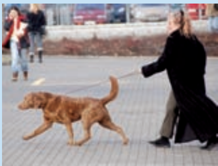
Bez dlouhých procházek se neobejde