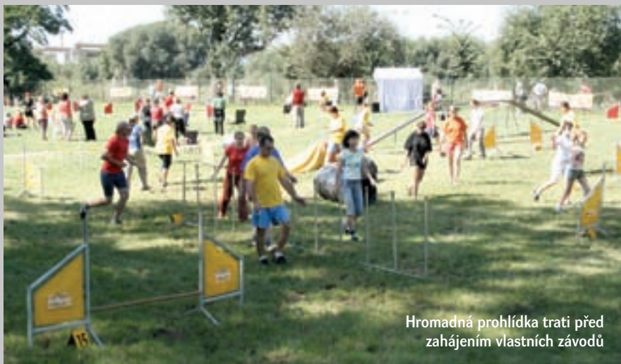
Hromadná prohlídka trati před zahájením vlastních závodů

Jedním z takto „postižených“ soutěžních klání jsou také Noční hrátky. Agility víkend, který se však léty konání dopracoval už k poslednímu čtvrtku v srpnu, aby pak závěrečný prázdninový víkend mohl na pražském komořanském cvičišti proběhnout maraton závodů a soutěží, které končí až kolem půlnoci.