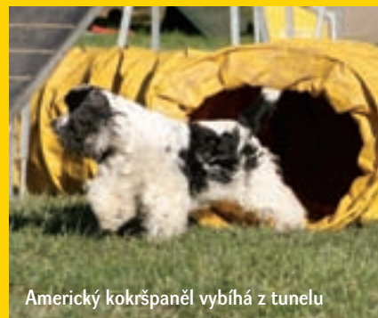
Americký kokršpaněl vybíhá z tunelu