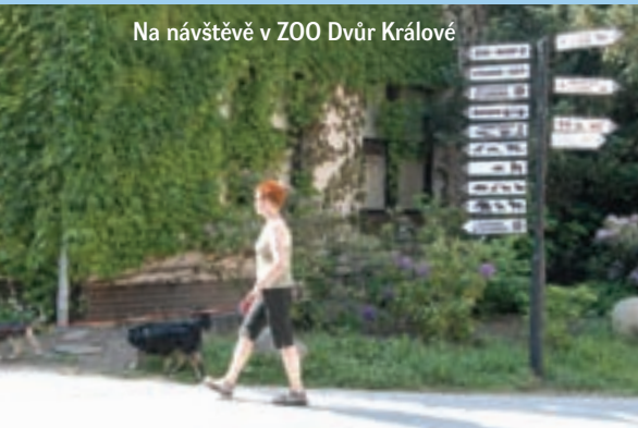
Na návštěvě v ZOO Dvůr Králové