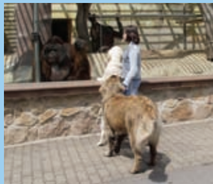
V Zoo Ústí nad Labem