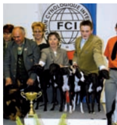
Chov. sk. (so): Vipeť Ayort Back, chov P. Němec