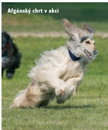
Afgánský chrt v akci

Není sporu o tom, že coursing byl původně určen pouze pro chrtý. Toto sportovní odvětví jim nahrazovalo jejich přiroze-