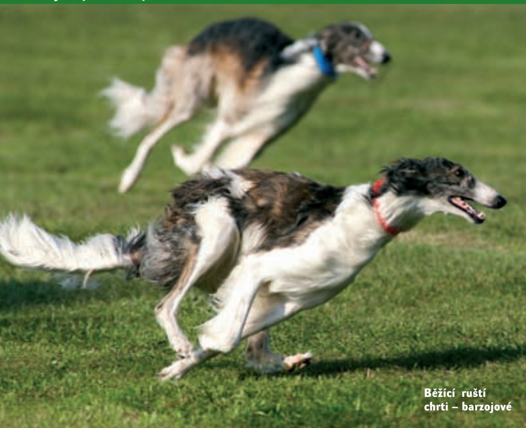
Běžící ruští chrti – barzojové