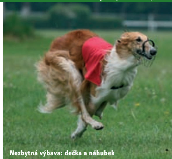
Nezbytná výbava: dečka a náhubek

coursingcz.info – Český coursingový klub, první založený klub u nás, pořádá oficiální závody, jejichž součástí bývají i tréninky www.msccoursing.com - Moravskoslezský coursingový klub, pořádající kromě mnoha oficiálních závodů a tréninků plno přátelských setkání, coursingový camp a víkendové pobyty www.coursing.net – Okolopražský coursingový klub www.coursingbrno.cz – Brněnský klub, nejmladší z coursingových klubů, zatím pořádá tréninky a několikadenní pobyty pro zájemce o coursing www.coursing.sk - Slovenský coursingový klub