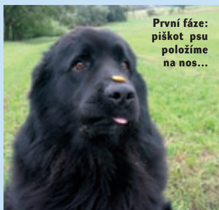
První fáze: piškot psu položíme na nos...

T ento trik vypadá velice efektně, bohužel ti, kdož se se svým psem věnují dogdancingu, jej nemohou zařadit do sestavy, protože používání pamlsků na taneční ploše je zakázáno. Zaručeně ale sklídíte úspěch u všech příbuzných a známých. Stejně jako u kteréhokoliv jiného cviku je potřeba postupovat pomalu, rozdělit si celý cvik do několika dílčích kroků a dát psovi čas pochopit, co po něm chceme.