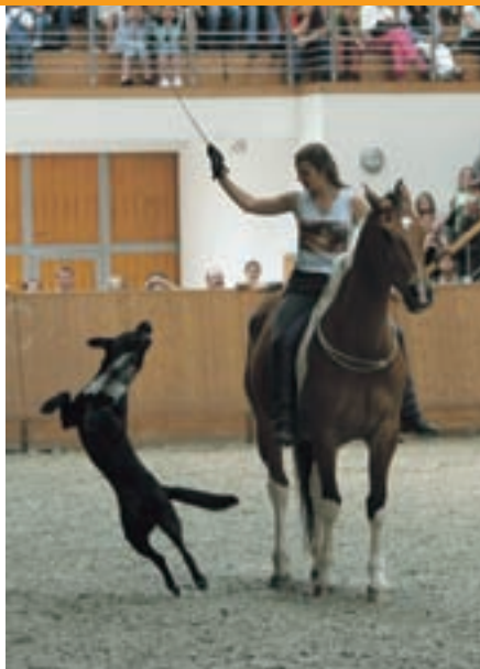
Vystoupení před zaplněnou halou na Trojském ostrově

Při uvykání psa na koně a opačně je nejdůležitější, aby z vás obě zvířata měla respekt. Když do stáje přivádíte malé štěňátko, je logické, že ještě neumí moc poslouchat, a o to lépe vycvičeného koně byste měli mít. Ideální je, když je kůň na psy již zvyklý a nekope po nich, protože kopající kůň představuje pro malé štěně smrtelné nebezpečí. Štěňátko je třeba vysvětlit, že kůň není věc na hraní a že může být nebezpečný. Rozhodně musí zapomenout na hry koňským ocasem, bližší zkoumání koňských kopyt, zkouše-