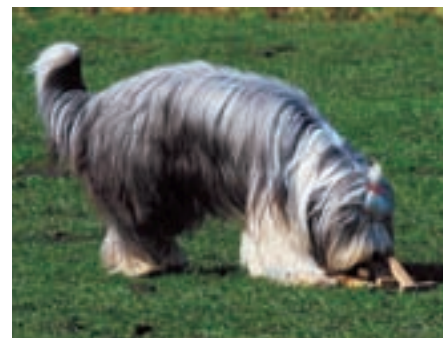
Rozlišování předmětů procvičí čichové schopnosti psa

Nerozlišují se závody a zkoušky - každý závod je zkouškou a naopak. Rozhodčí na závodě (=zkoušce) nedává soutěžící-