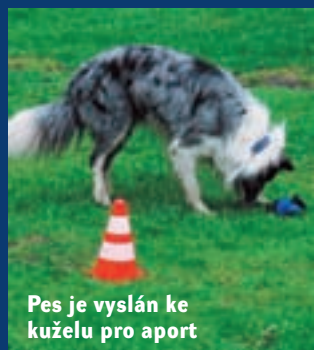
Pes je vyslán ke kuželu pro aport

OB3 Pes musí zůstat sedět ve skupině 3 až 8 psů po dobu dvou minut, psovod je v úkrytu.