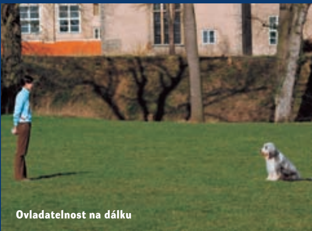
Ovladatelnost na dálku

OB3 20 metrů od výchozí mety jsou na zemi umístěny 3 aportovací činky vzdálené od sebe 5 metrů. 10 metrů od výchozí mety je umístěn kužel, ke kterému je pes vyslán. Následně je pes vyslán vpravo nebo vlevo pro aportovací činku (určuje se předem losem), tu přinese psovodovi.