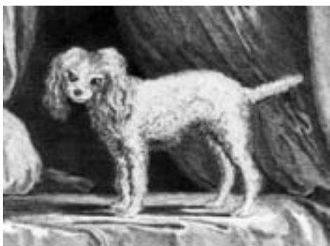
„Malý barbet“, Buffon, Histoire naturelle 1772

světě, nejvíce ale ve Francii a Španělsku. Stoupenci názoru, že je pudl původu německého, dovozují, že se do Španěl pudlíci dostali teprve za válek na počátku století osmnáctého, a že tím ku vzniku psů španělů základ položili. Leč z druhé strany hypotéza ta vyvrací důkazy, že plémě španělů jest oproti pudlům starší nejméně o 2 až 3 století.“ Za nejstarší zobrazení „německého“ pudla je však považován dře-