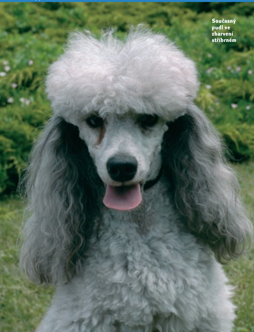
Současný pudl ve zbarvení stříbrném

H ans Räber uvádí, že „pfudel“ je staré německé dialektické slovo pro kaluž vody, a dovozuje z toho příčinnou souvislost s obdobně označovanými psy (Budl, Buddel) a jejich spoji-