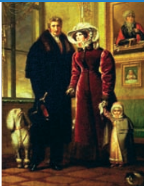
Neznámý český miniaturista, rodinný portrét s pudlem, 20. léta 19. století

vořez Hanse Burgmaira, zachycující na lví stříh upraveného psíka vesele poskakujícího podél triumfálního průvodu německého krále Maxmiliána I. (1459 - 1519).