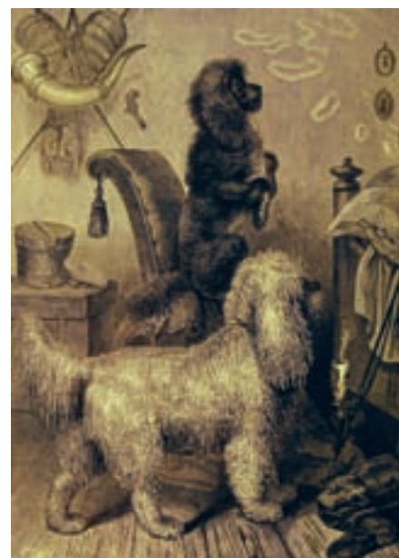
Němečtí pudlové (German poodles) v knize Vero Shawa z roku 1881

tost s vodou. Není náhodné, že pudl byl ve Francii zván též chien mouton, ovčák. Na německém území byl už velmi dlouho znám vývojově přechodný či „křížený“ typ psa, takzvaně ovčácký nebo ovčí pudl - Schafpudel, a dokonce z ruského území je připomínán dnes již dávno vyhynulý černý vodní pes. Výskyt podobného typu psa na různých místech Evropy vedl ke sporům o původ pudla, zejména mezi Francouzi a Němci.