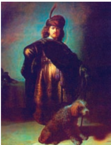
Vlastní portrét Rembrandta van Rijna (1606 – 1669) v orientálním kostýmu s pudlem ještě výrazně připomínajícím barbeta