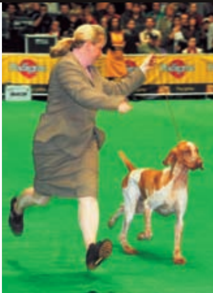
Takto si tato dvojice doběhla pro absolutní vítězství: BIS

Především Poláci, ale i četní hosté z ciziny, zvláště v sobotu doslova zaplavili obrovskou plochu poznaňského výstaviště. Komu se podařilo probojovat do hlediště mainringu, kde se každý podvečer odehrávaly finálové boje, mohl hovořit o velkém štěstí. I na místech vyhrazených pro novináře se chvílemi o volná sedadla sváděly téměř bitvy.