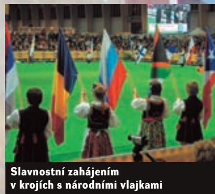
Slavnostní zahájení v krojích s národními vlajkami

Přesto se o to rok co rok pokoušejí nejrenomovanější světoví rozhodčí s aprobací na všechna plemena psů, takzvaní all-roundři. I při vědomí veškeré ošidnosti a nejednoznačnosti takového rozhodování jsme se však i my v Poznani dali strhnout a spolu s nadšenými diváky po čtyři finálové večery se zatajeným dechem sledovali napínavý soubor o pomyslnou korunku letošního psiho krále. Ve čtvrtek nejvíce okouzlili a ve svých skupinách zvítězili bobtail, drsnorstý jezevčík a velký japonský pes, v pátek k nim přibyl velšteriér, velký vendénský baset a irský vlkodav, v sobotu se stal jednoznačným miláčkem diváků novofundlandský pes