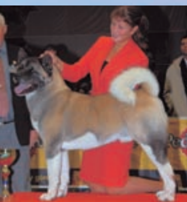
V. Velký japonský pes Redwitch AFTER THE DANCE, maj. Lunden a Brohlin