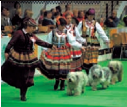
Prezentace polského národního plemena: PONA