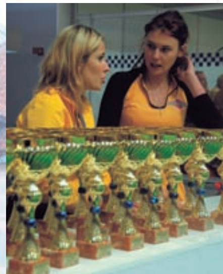
Poháry připravené pro nejlepší představitele svého plemene: BOB

na akci pořádané největší evropskou kynologickou organizací. S jejím emblémem ani jiným způsobem prezentace jste se na výstavišti prakticky nestkali, výstavní plochy plně ovládly jen žlutočervené barvy hlavního sponzora, firmy Pedigree. Strohost jako hlavní rys výstavy zvláště vynikla při závěrečných soutěžích. Každý, kdo už někdy zažil, v jak strhující show plné světla, barev a nejrůznějších efektů se finálové soutěže na velkých kynologických akcích dokážou proměnit, kdo očekával