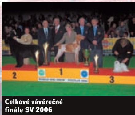
Celkové závěrečné finále SV 2006

plemení se budeme blíže věnovat v příštím čísle našeho časopisu.) Nadšení diváků neznalo mezí.