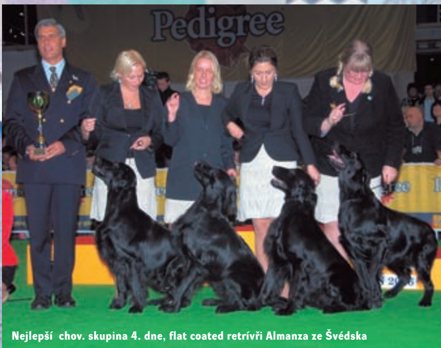
Nejlepší chov. skupina 4. dne, flat coated retrívři Almanza ze Švédska

Ale abychom pořadatelům nekřivdili. Dokázali vtisknout finálovým soutěžím důstojný rámec tím, že vlajky všech zúčastněných států na začátku prezentovaly děti v polských národních krojích. Skvěle dokázali Poláci využít příležitosti k propagaci svých národních plemen. Byla na všech informačních materiálech, na samostatné emisi poštovních známek vydané ku příležitosti výstavy, jejich reprezentativní a skutečně početné ukázky zahajovaly každý finálový večer, skutečnila se i soutěž o nejkrásnějšího jedince polského plemene. To všechno a také trpělivá přesvědčovací práce polských kynologů přineslo své ovoce: na závěr bylo slavnostně oznámeno, že FCI přijala do svých řad páté, prozatím neuznané polské národní plemeno, polského honiče - gonczy polski. (Tomuto staronovému