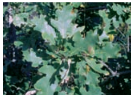
Dub pomáhá statečným zvířatům