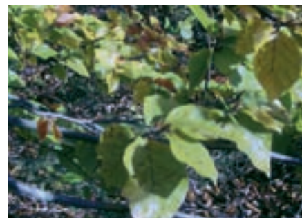
Beech pomáhá zvířatům k větší flexibilitě