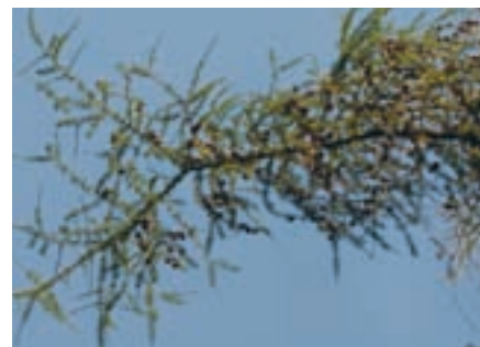
Modřín pomáhá ustrašeným a nejistým