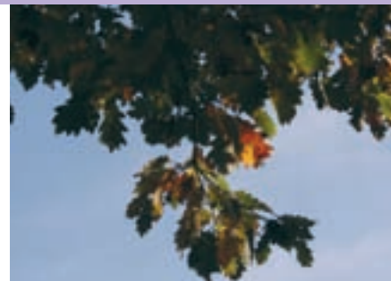
Dub, z něhož je vyráběn Oak.

Speciálním postupem při přípravě těchto květů (takzvaná sluneční a varná metoda) jsou energetické vzorce rostlin přenášeny do vody, která je skladována ve speciálních strukturách krystalicko-tekuté části vody. Tyto struktury nazýváme cluster